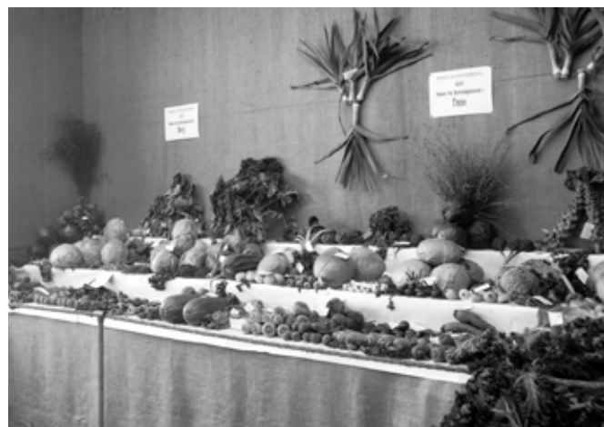
Resultatet av «Dyrkningskurset i Tune».

Hovedrestauranten hadde øl og vinrett, plass til 1300 gjester (800 innendørs) og «alt hva man kan forlange til legemets vederkvegelse», som journalisten i Sarpsborg Arbeiderblad bemerket. Suppe, en rett og en dessert kostet kr 2.50, kaffe 50 øre per kopp. Det var dans og musikk ute og inne. Ungdomsskoleelever, foreninger og tilreisende skolebarn fikk billigere priser om de meldte fra én dag på forhånd. I restauranten «Havbunden» ble det ifølge brosjyren servert fiskeretter og standardretter til rimelige priser. «Søilehaven restaurant og konditori» ble bestyrt av Sarps-