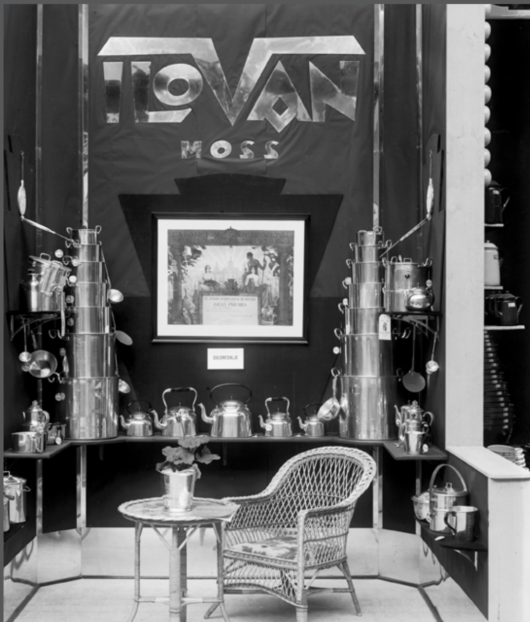
II-O-Van, like viktig på kjøkkenet som ild og vann. Produsent av kjøkkentøy i Moss fra 1922. Bildet på vegg er diplom for tildelt gullmedalje til II-O-Van på verdensutstillingen i Barcelona 1929.