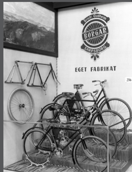
Firmaet Brødrene Gudheim i Sarpsborg stilte ut sin sykkelmodell «Borgar». For denne fikk de gullmedalje.