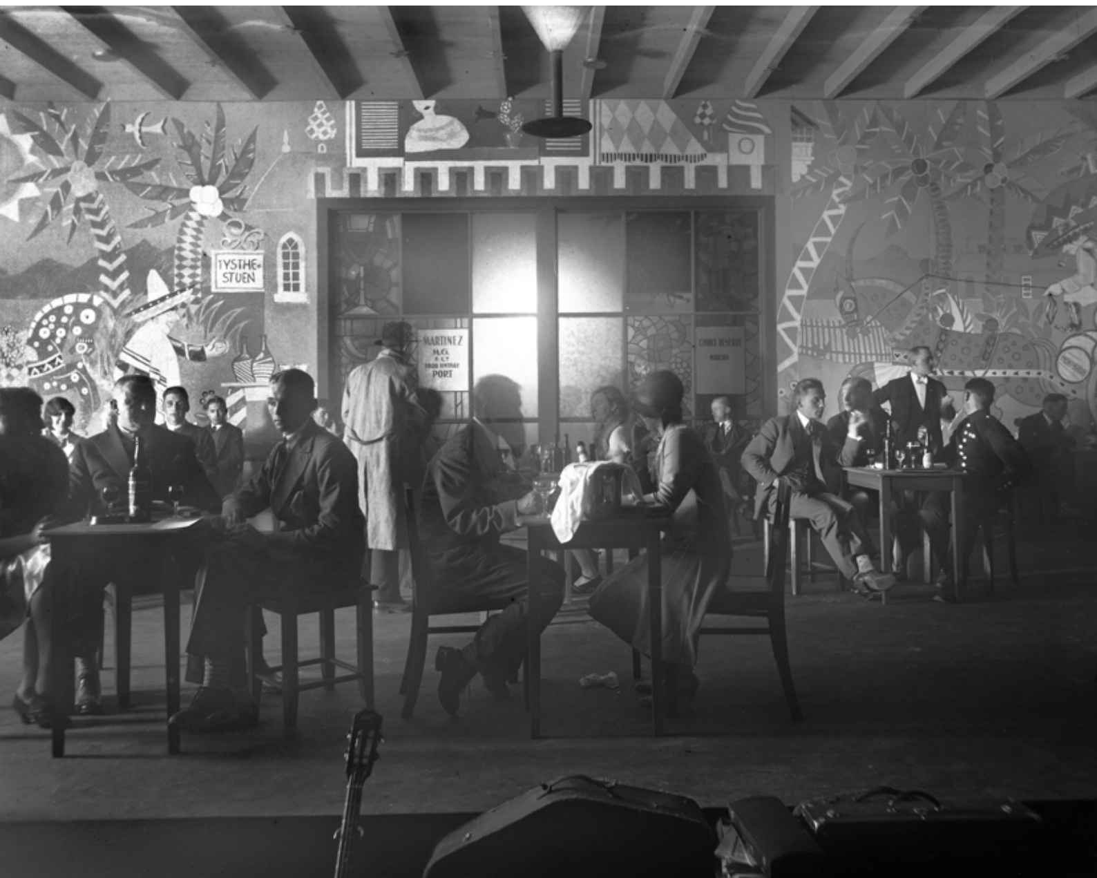
Fra bodegaen med røykfull stemning, øl, madeira og portvin i glassene.