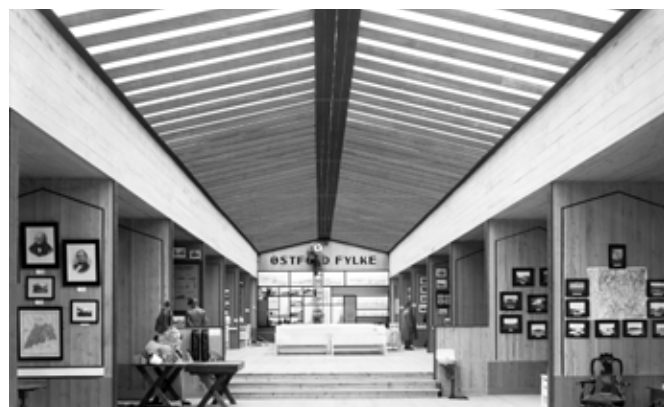
Fra hallen til Østfold fylke.

tidig var det Østfold landbruksksselskaps 100-års jubileum. Med utstillingen ønsket man å vise fylkets utvikling innen nærings- og kulturliv. 12