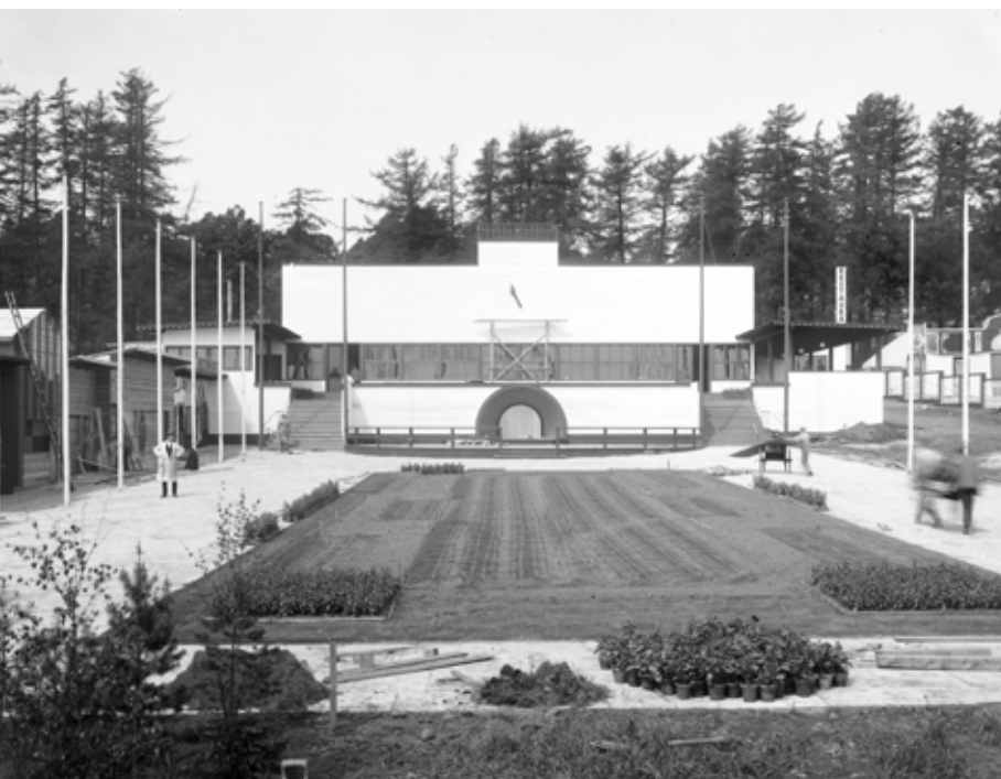
Hovedrestaurant og salgsboder er snart ferdig bygget. Kan det være arkitekten i hvit frakk som tar et overblikk?

Vi har nylig tatt et flybillede av utstillingen med dens nærmeste omgivelser.» Deretter skildres utstillingen og Kongens besøk: «Åpningshøitideligheten blir kringkastet, og det er også meningen at den skal lydfilmes». 29 Om dette ble noe av, vites ikke. Den første lydfilmen ble vist på kino i Oslo året før, 30 og i august 1930 ble lydfilm introdusert for mosingene, med stor suksess. 31