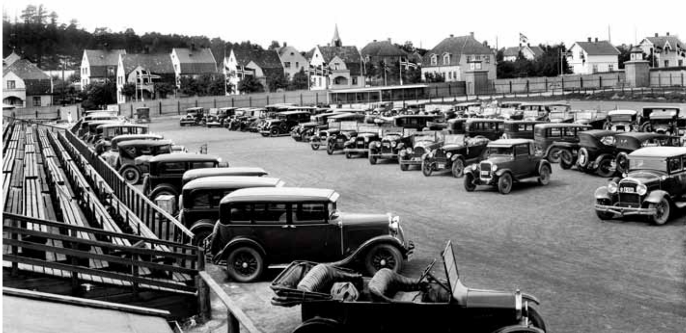
Fra parkeringsplassen på den gamle idrettsplassen. I bakgrunnen Oscar Pedersens vei.

Trøndelag-utstillingen i Trondheim samme år. 24 En norsk dame ble sendt på foredragsturne til England for å promotere Norge som turistmål, og hun ble selvsagt utstyrt med engelsk tekst og reklame for Østfoldutstillingen.