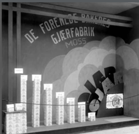
De forenede bakers gjærfabrik i Moss, i 1923 hadde de tilhold i Gudesgate 1 i Moss.