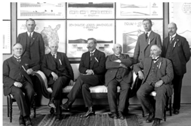
Hovedkomiteen fotografert i utstillingen.

I 1928 besluttet Sarpsborg kommune og Østfold fylke å gå sammen om en større utstilling i 1930. Sarpsborg by ville da kunne feire 900-årsdagen for Hellig Olavs fall. Sam-