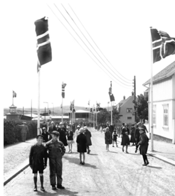
Inn til utstillingsporten fra Oscar Pedersens vei. Hele gateløpet hadde flaggstenger på begge sider.

stilles grafisk og billedlig med figurer som kjennetegnet den enkelte kommune; Idd fikk stenhuggere, Hvaler fikk fiskere og det ble «skogsmenn» i Aremark og Rømskog. Alle ordførerne skulle males gjenkjennelige. Formue og inntekt for hver ordfører. Utstillingsbygningen skulle også males i rødt og gult. 18