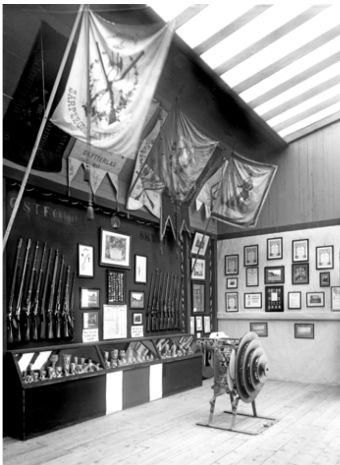
I turist- og sportshallen hadde Østfold skyttersamlag stilt ut faner og premier.

kan sammenfalles til en koffert. Og kan Larsen ha bestilt kameraet fra Nerlien i Oslo? 11