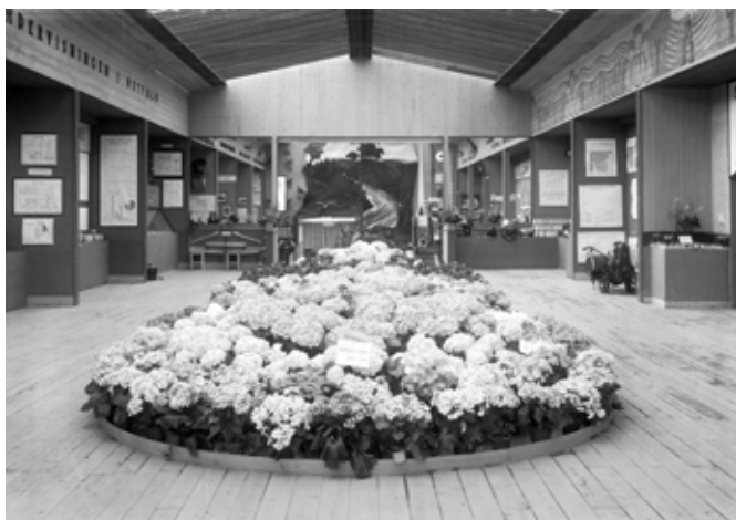
Fra sommerutstillingen for gartneri og hagebruk.

det vist et «idealhus» på Opsund, etter tegning av utstillingsarkitekt Arne Pedersen. Det var innredet med «praktiske» møbler tegnet av interiørarkitekt frk. Karsten. 40 Man anbefalte også et besøk til byens nybygde stadion.