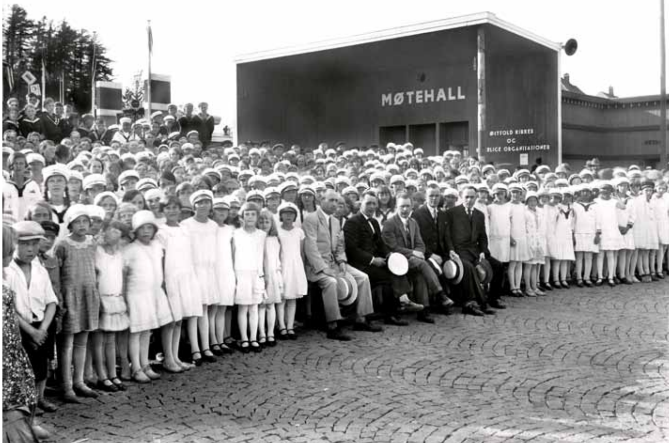
Unge sangere fra korene Vårsang, Hafslund, Hannestad, St. Croix, Smertu og Kjølberg i sin fineste stas! Disse holdt konsert på sangerstevnet for barnekor i Østfold i pinsen.