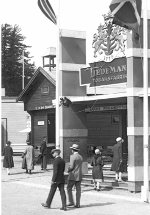
Her kunne man få gratis reklamefoto.