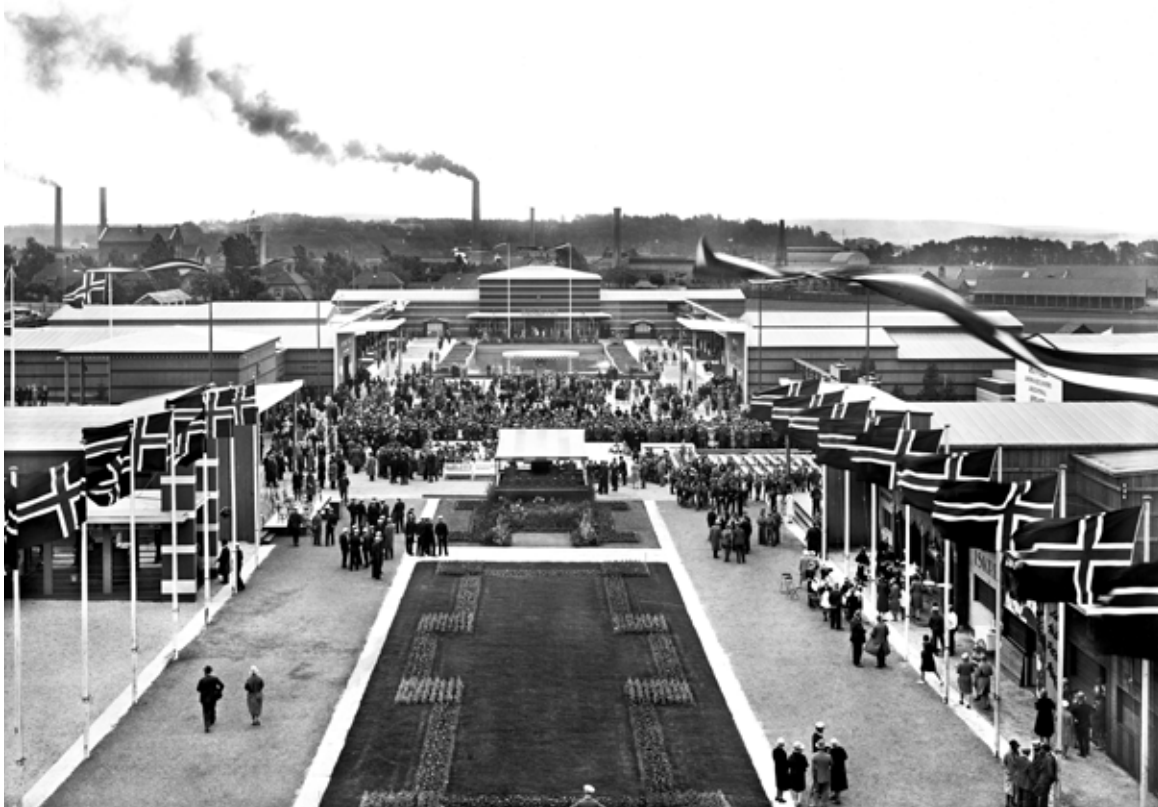
Hele festplassen i all sin prakt.