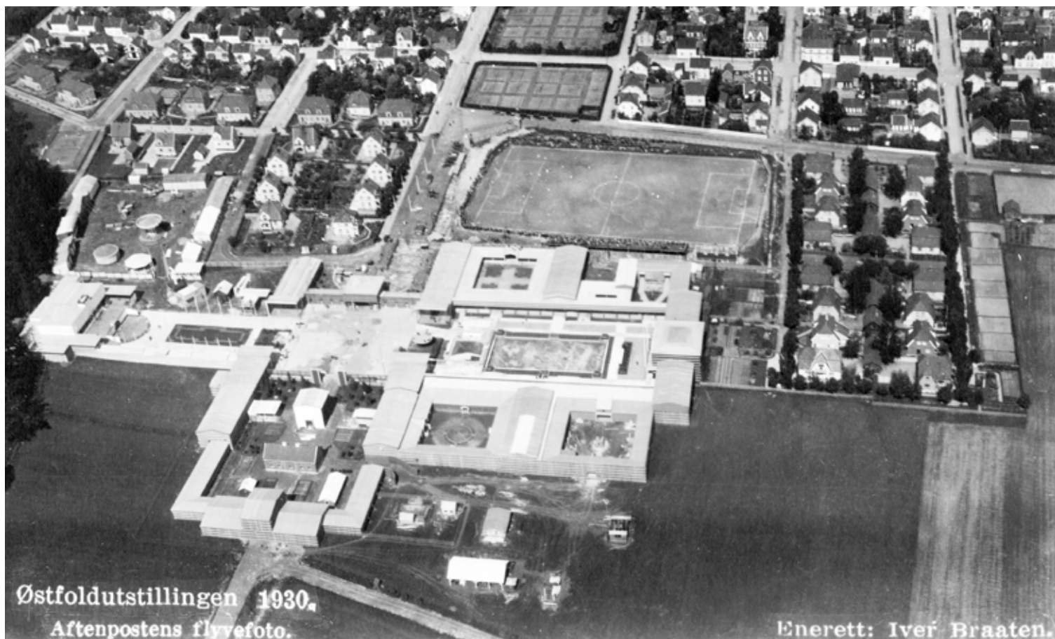
Utstillingsområdet fotografert de siste dagene i mai 1930.

Utstillingen hadde eget vaktmannskap. De ansatte var delt i to dagskift og ett nattevaktskift. De måtte bære uniform og hadde militær hilsningsplikt overfor sine overordnede. 28 Oppgavene var å hindre tyveri, skade og brann, informere publikum, hjelpe til ved ulykker og geleide til «sanitetshus» ved sykdom. Ordensvernet besto av russen fra alle Østfold-byene, speidere og elever fra underoffisersskolen i Halden.