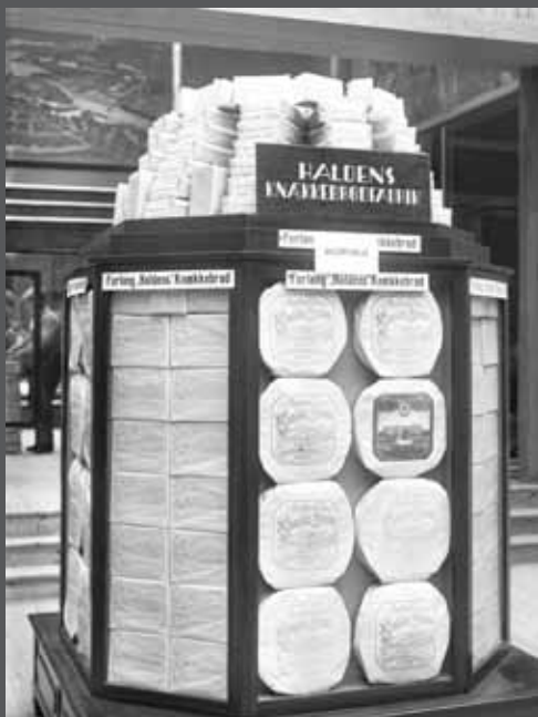
Forlang «Haldens» Knækkebrød! For denne monterer fikk Haldens Knækkebrødfabrik gullmedalje.