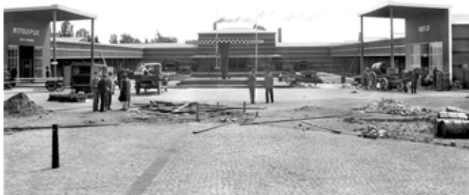
Musikkpaviljongen foran industrihallen, tegnet av arkitekt Arne Pedersen. Både motorvogner og hestekjoretøy er i bruk i det som ser ut til å være innspurten før åpning.

Sarpsborg så helt annerledes ut med sine moderne, rette og funksjonalistiske former. Utstillingen i Stockholm ble et gjennombrudd for funksjonalistisk arkitektur og form, mens utstillingsbygningene i Trondheim og Drammen var ikke så konsekvent funksjonalistiske. 16