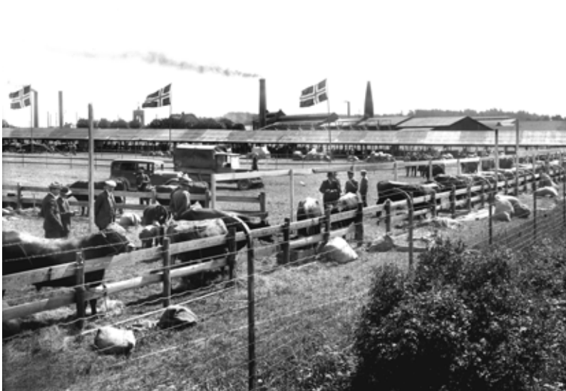
Fra dyrsku. Jordbruksmaskiner er plassert i bakgrunnen under halvtak.

Under hele perioden ble det holdt kortvarige spesialutstillinger. Landbruksselskapene i Østfold feiret hundre-