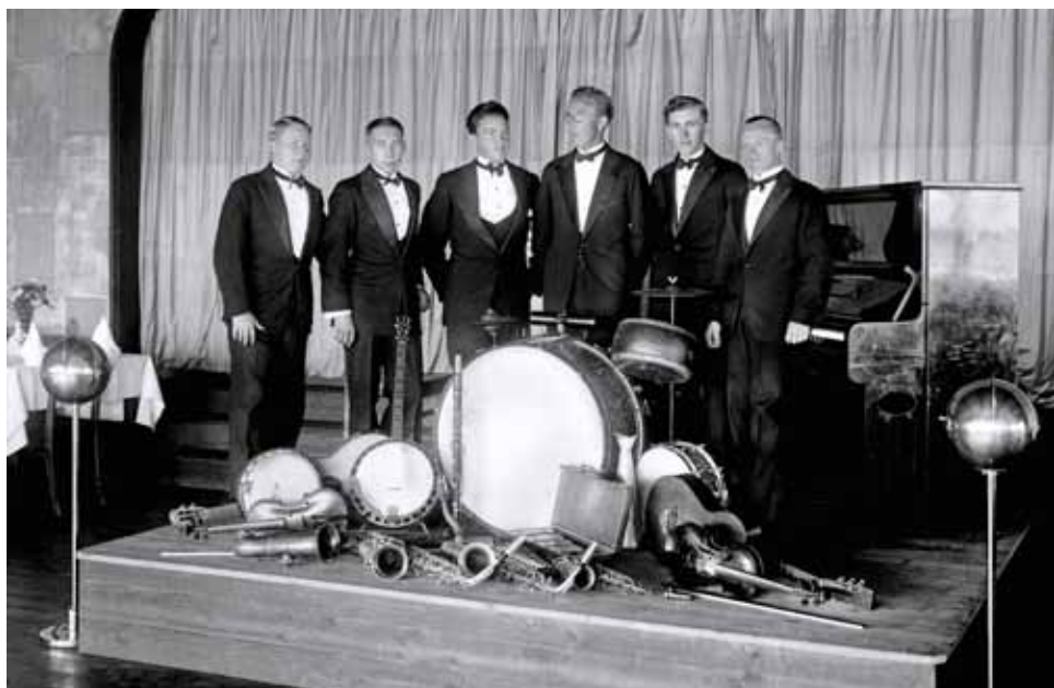
Det var daglig orkestermusikk i restauranten. Utvalget av musikkinstrumenter kan tyde på swingende jazzrytmer.

hadde fotografene oppsøkt offentlige steder dere mange folk ble samlet, som på markeder, dyrsku, badestrender og utstillinger. Visittkort-formatet tillot at fotografen kunne få fremkalt kopiene ganske snart på stedet. Men nå var det altså en automatisk maskin som tok bildet. 43