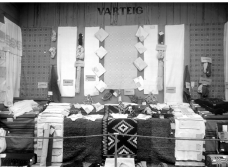
Mange kommuner deltok i husflidavdelingen, og kvinnene fra Varteig fikk mange medaljer.