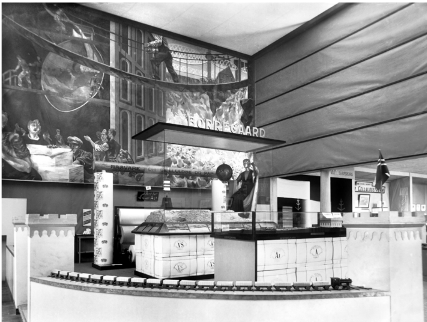
Borregaards Barcelona-monter med Per Krohgs maleri i bakgrunnen.

meter lang og 13 meter bred, og her skulle treforedlingsindustrien, fløtningen og skogbruket få plass. Dermed var utstillingen nå på samme størrelse som Värmlandsutstillingen i Karlstad året før.