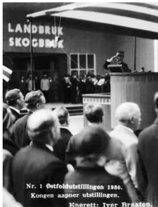
Aftenpostens foto (utsnitt) av kongen som taler på åpningsdagen. Bildet ble også utgitt som postkort.

Det var en stor begivenhet at hele utstillingsområdet ble fotografert fra fly, til og med av en hovedstadsavis. Det fantes flygere fra Marinens Flyvevæsen i Horten og Hærens Flyvevæsen på Kjeller 32 som på slutten av 20-tallet