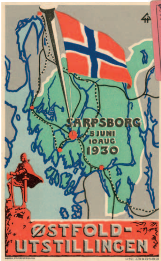
Plakaten var tegnet av generalsekretæren Gunnar Hanssen, med yrkestittel korrespondent.

saker til alle de 33 lokalkomiteene i kommunene. De regnet med at det ville være «regningssvarende å la forsendelse skje direkte til disse pr. Omnibus». Personbussen ble tapetsert