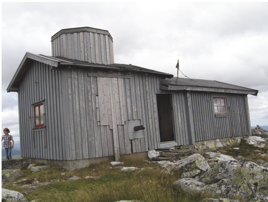
Brannvakthytta på Store Byringen. Den delen av hytta som ligger lengst til venstre på bildet, er bygd til etter at "Den ensomme vaktpost" ble skrevet.

steinalderen, "Dag fra skogene" (1941) fra bronsealderen og "Geir den fredlause" (1944) fra folkevandringstida. Målet med bøkene var å formidle historiske kunnskaper til barn og unge slik at det vekket deres interesse. I flere tiår ble disse bøkene, som kom på både bokmål og nynorsk, brukt som utfyllende lesning i folkeskolen. De forener på en ypperlig måte sakprosa og fiksjon.