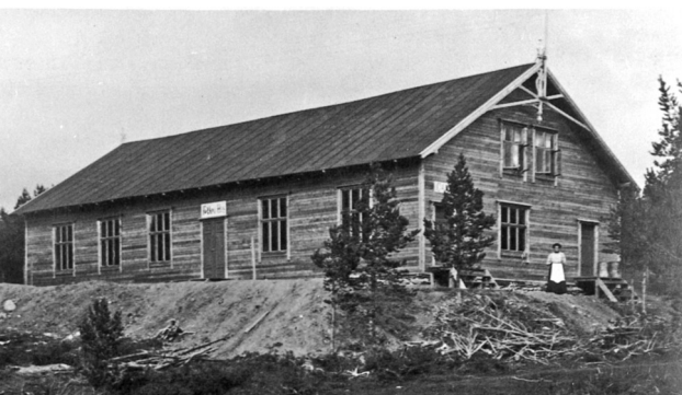
Folkets Hus, like etter huset var ferdig i 1909. Her var det også kafe, kafevertinna ses t. h. på bildet. Repro: Nordøsterdalsmuseet 24554

Folldal hadde et aktivt fagforeningsmiljø. Dette ga seg også utslag i dannelsen av mange andre politiske foreninger. Folldal Arbeiderparti vart stifta i 1912 og Folldal Arbeiderkvinnelag i 1914, Sosialdemokratisk Ungdomslag i 1911. Det var også et aktivt syndikalistmiljø i Folldal, særlig i 1920-åra. Gruvearbeiderne reiste også sitt eget hus. Tomt vart kjøpt i 1908, og i mars 1909 kunne Folkets Hus innvies.