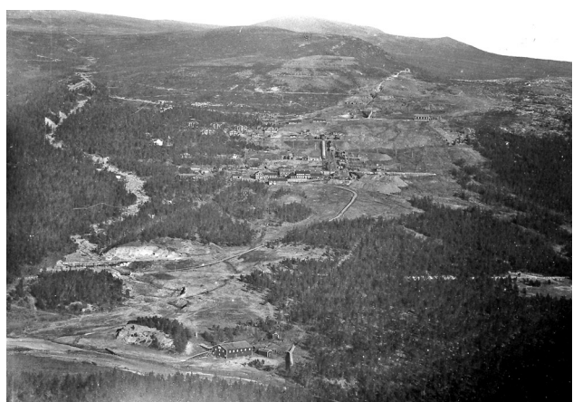
"Folldals Værk pr. Lilleelvdalen Norge" viser verkssområdet 1910. Her ser vi tydelig den store aktiviteten som etter bare fem års byggevirkosmhet, preget og fremdeles preger landskapet.

Gruva i Folldal var i regulær drift fra januar 1907. Da var om lag 450 arbeidere og funksjonærer ved Verket. Det kan nevnes at ved folketellinga i 1900