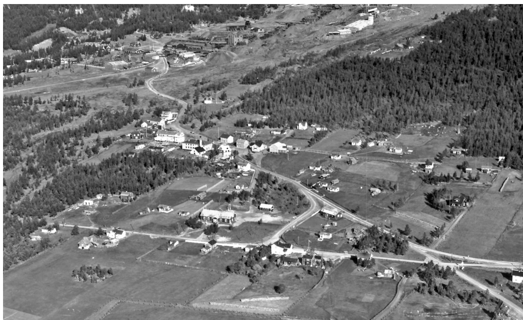
Verket og Folldal sentrum 1936. Øverst på bildet ser vi Folldal Verk, midt i bildet Folldal Folkets Hus (1909-78) med meieri og forretninger. Foto: Widerøe. Repro: Nordøsterdalsmuseet 18238

Arild Alander, 2580 Folldal Viggo Stuedal, 2500 Tynset