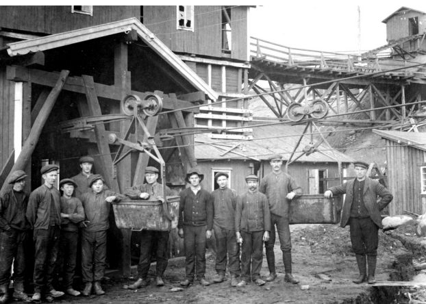
Taubanestasjonen, lastestasjonen ved Verket. Repro: Nordøsterdalsmuseet 29430

Først i slutten av januar 1906 bestemte det gamle selskapet seg for å selge det hele til The Foldal Copper & Sulpher Co. Ltd., som det engelske selskapet het.