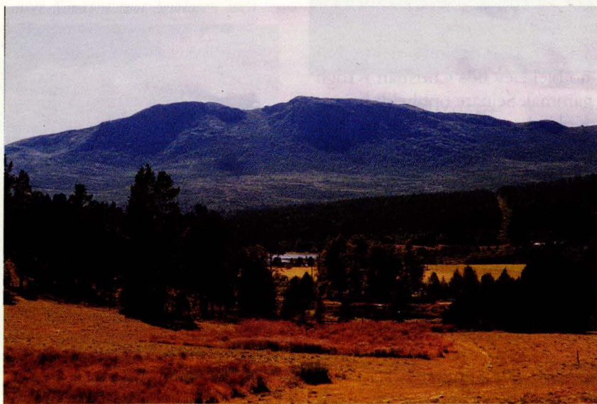
Einundfjellet sommaren 1998. Bildet er tatt frå jordet på Furulund (Hangerud) i Strålsjøåsen. Vi ser Strålsjøen bak skogen, og Einundfjellet. Furulund er eit bureisingsbruk frå 1920.