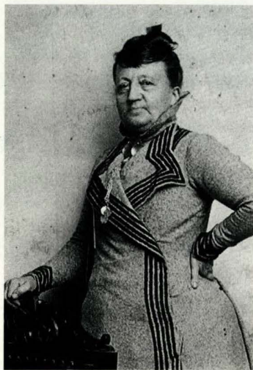
Kitty Kielland (1843-1914)

Frå 1889 budde Kitty Kielland i Kristiania. Om somrane gjorde ho mange reiser til Alvdal, Jæren og andre stader. Fleire gonger var ho gjest på Kolbotnen og på Strålsjøåsen. «Kitty L. Kielland, ho målar av det, som er utanomhus, eng og åker og li og ås og sjø og skyer og alt som er, like til dei svarte torvmyrane burtpå Jæren», skreiv Arne Garborg om henne. Og det var først og fremst landskapsmålar ho var. Ho kunne neppe ha vore like begeistra for naturen i Nord-Østerdalen som Harriet Backer var, for iallfall finst det ikkje landskapsmåleri frå desse traktene etter henne. Motiva sine henta ho helst frå Jæren.