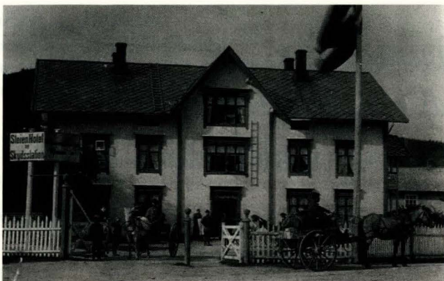
Steien Hotel, Alvdal, bygd i 1877. I 1893 blei Steien «Skydsstation» i Nord-Østerdalen Fogderi.

Eitt av vitnemåla om studieferdene noen av dei kvinnelege kunstnarane hadde til Nord-Østerdalen er ei bevart skyssdagbok for åra 1894-98 frå Steien Hotel på Alvdal. Steien Hotel, som starta hoteldrift i 1877, var nemleg overnattingsstad for mest alle byfolk som kom frå Kristiania og som