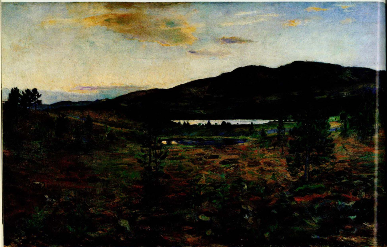
Harriet Backer: Einundfjell, 1897. Olje på lerret. 79,8 x 131,2 cm. Rasmus Meyers Samlinger, Bergen.