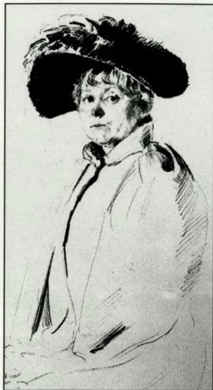
Harriet Backer (1845-1932)

Kontakten med Arne Garborg fekk stor betydning for Harriet Backer. Ho skreiv mange brev til han om bøkene hans og om sine eigne måleri utover i åtti- og nittiåra. Ho var særleg opptatt av kristendom og religiøsitet. Kyrkjeinteriora hennes frå 1890-åra kan sjåast som ein parallell til forfattarskapen til Garborg.