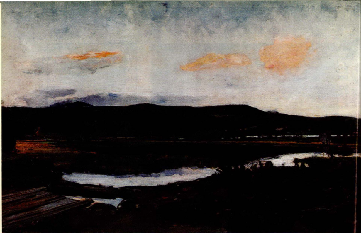
Harriet Backer: Østerdalskveld, 1897. Olje på lerret. 86 x 137 cm. Pe. Mye tyder på at dette måleriet var i arbeid heilt fram til 1902.