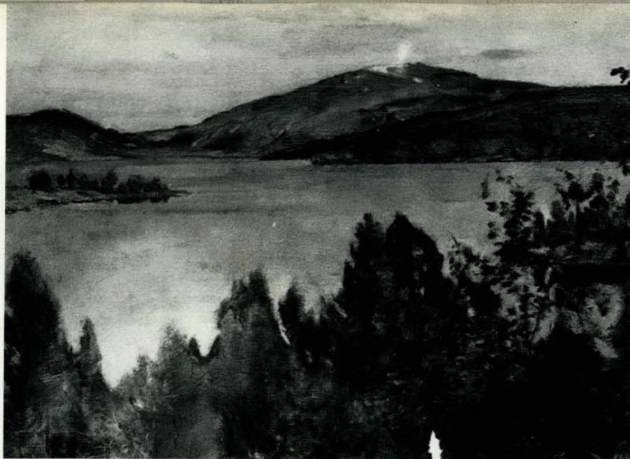
Harriet Backer: Utsikt mot Tronfjell(1897)

Same motivet fotografert frå Kolbotn sommaren 1998. Vi ser ut- over Savalen mot Sivilosen med Tronfjell i bakgrunnen.