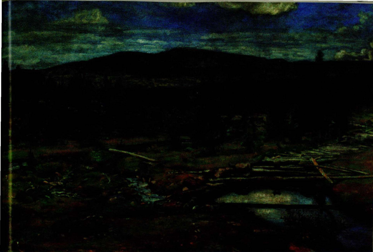
Sara Horneman: Fra Einundfjellet i Lilleelvdalen, 1901. Trondheim Kunstmuseum, Trondheim.