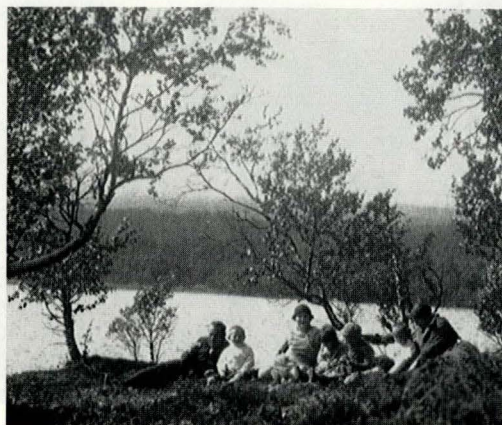
På utflukt til "Øya" i Langenvannet.

På oversiden av gården var et engstykke med utelade, som tilhørte en gård i kirkebygda Vingelen. Fra engstykket var det sti videre opp til vidda, hvor vi kunne se Langsfjellhogna, med sine 1200 m.o.h. Ved «sommer-fjøset» var det gjerde og grind, hvorfra vi kunne følge en sti/kløvvei til postkontoret som het Vangrøfta. Dette lå ca. tre kilometer videre i retning Os.