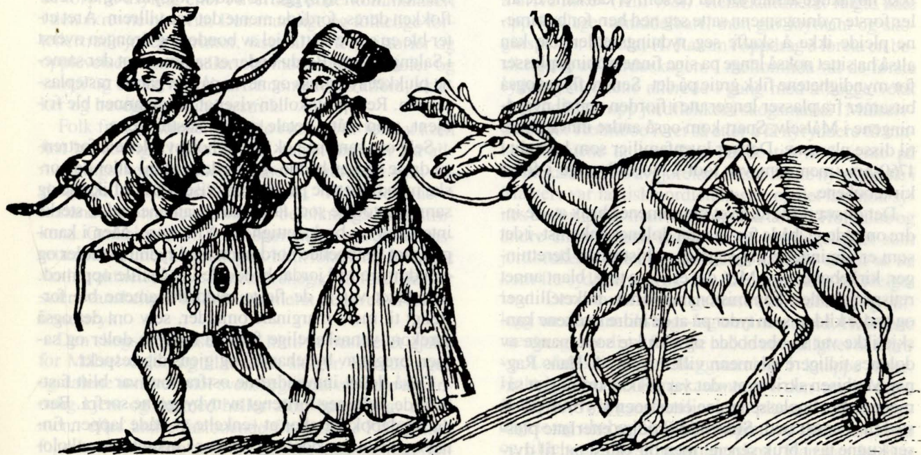
Samer på reise. Illustrasjon i Schefferus: Lapponia 1673. Gjengitt etter A. Kiil: Målselv bygdebok 1981.

Forfatteren av Målselv bygdehistorie skriver at «om de endeløse, ødslige og ubebodde skogene, der få nordmenn hadde satt sine føtter- og da bare i strøkene nærmest Malangen- dannet det seg naturlig nok sagn som gjorde dem til tilholdssted for røvere, stimenn og fredløse.» (Kiil 1981).