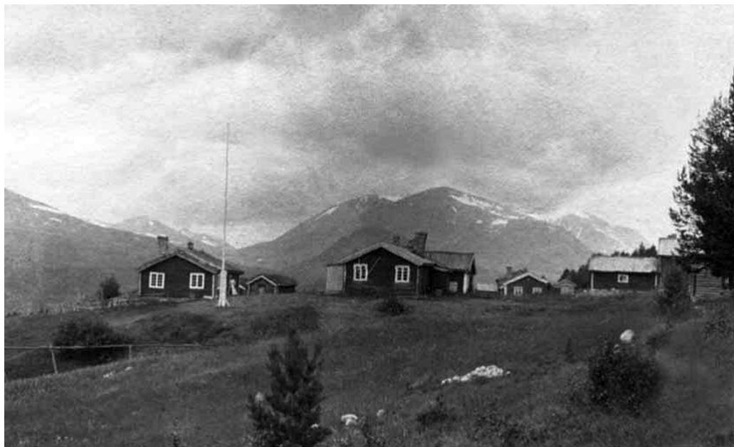
Sørnesset omlag 1910, slik det stort sett fortsatt var da Det Norske Videnskaps-Akademi overtok stedet i 1935.

og i sentrum for den vitenskapelige forskningen stod et miljø som vi i dag ville kalt "en naturvitenskapelig naturvernpolitisk-tenketank".