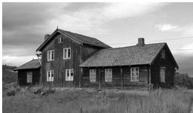
Kaffekvernbygning på Hummelvoll, Os.

Gruve / bergverk hadde seminar i Folldal. Bygningstradisjon langs grensen, interregprosjekt med bl a flere reiseseminarer for å studere lokal byggeskikk og restaurering.