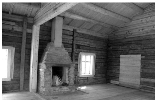
Formidlingshuset ved Lovise Hytte, Alvdal er klart til bruk.

Alvdal Museum, ferdigstilt formidlingshuset ved Lovise Hytte, bl.a. peis. Tynset Bygdemuseum: skifer på Pelsdyrsamlinga.