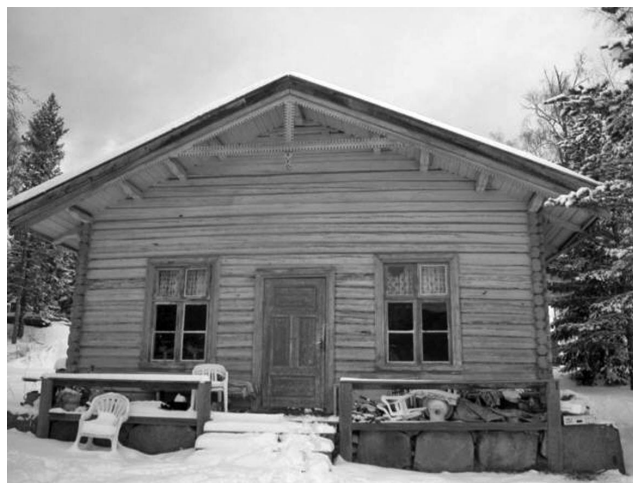
Snekkerstue på Sand, Rendalen.

Seterstue Marsjølia, 1664 innrisset ved peisen.