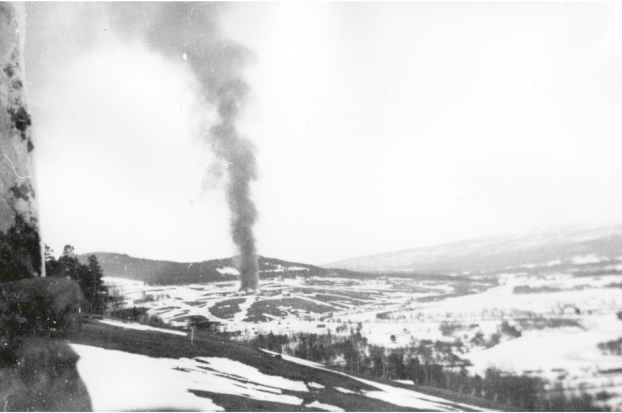
Os-gardene i brann etter kampene 2. mai 1940.

Når vi i år 2000, ved inngangen til et nytt årtusen feiret 9. april 1940, var det 60 år siden landet vårt brutalt ble angrepet av en fremmed makt og dermed mot vår vilje ble trukket med i den siste verdenskrigen. Både krigshandlingene våren 1940 og de 5 lange og harde okkupasjonsårene etterpå fram til fredsvåren 1945, rammet også fjellregionen sterkt. Perioden 1940-1945 vil derfor i vår historie bli stående som ett av de mest dramatiske og skjebnesvangre tidsskille her som ellers i landet vårt. Det er derfor viktig, særlig for nye generasjoner, å ta vare på de erfaringer vi fikk i denne skjebneperioden for land og folk.