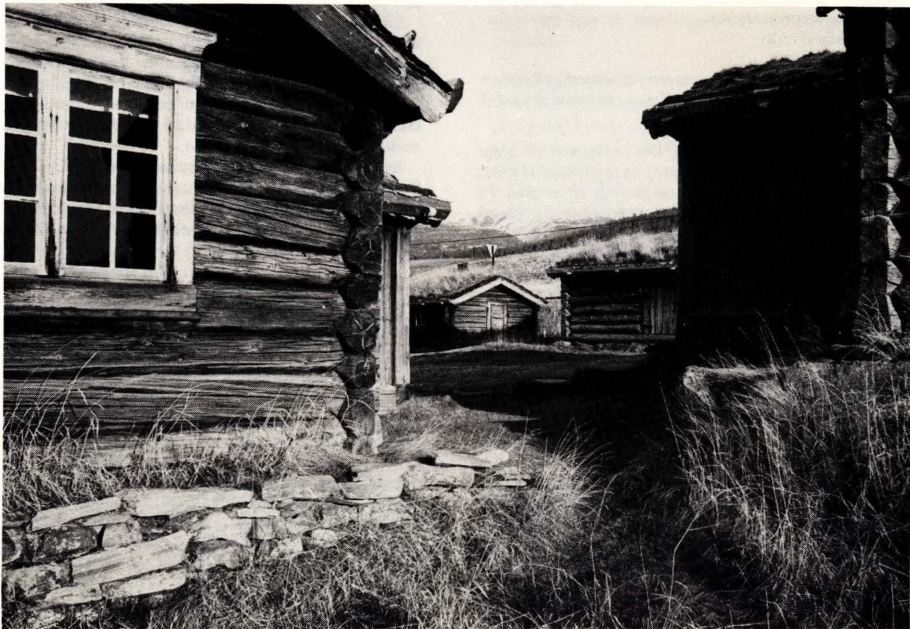
Et lite innsmett mellom sommer- og vinterstua på Husantunet, Alvdal.

Det er fortsatt noen nyanskaffelser av inventar og utstyr slik at det lettere kan arrangeres møter og andre sammenkomster i stuen på Husantunet. Styret fikk fullmakt til omdisponering av poster innen budsjettet. Det som på denne måten ble disponibelt er nytta til anskaffelse av et ekstra langbord og 2 benker, kjøkkenbenk, duker og diverse dekketøy.