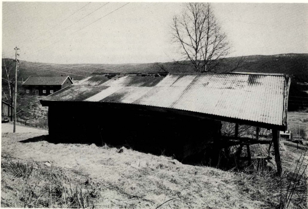
Smia etter smed Hansen i Øvre Rendal, nå en del av Bull-museet, men skal bevares på stedet. Museet ligger på nedsida av vegen.

Tynset Bygdemuseum - muring av trevklopper, omlegging av tak i Museumsparken, istandsetting av fjøset på Rams-moen.