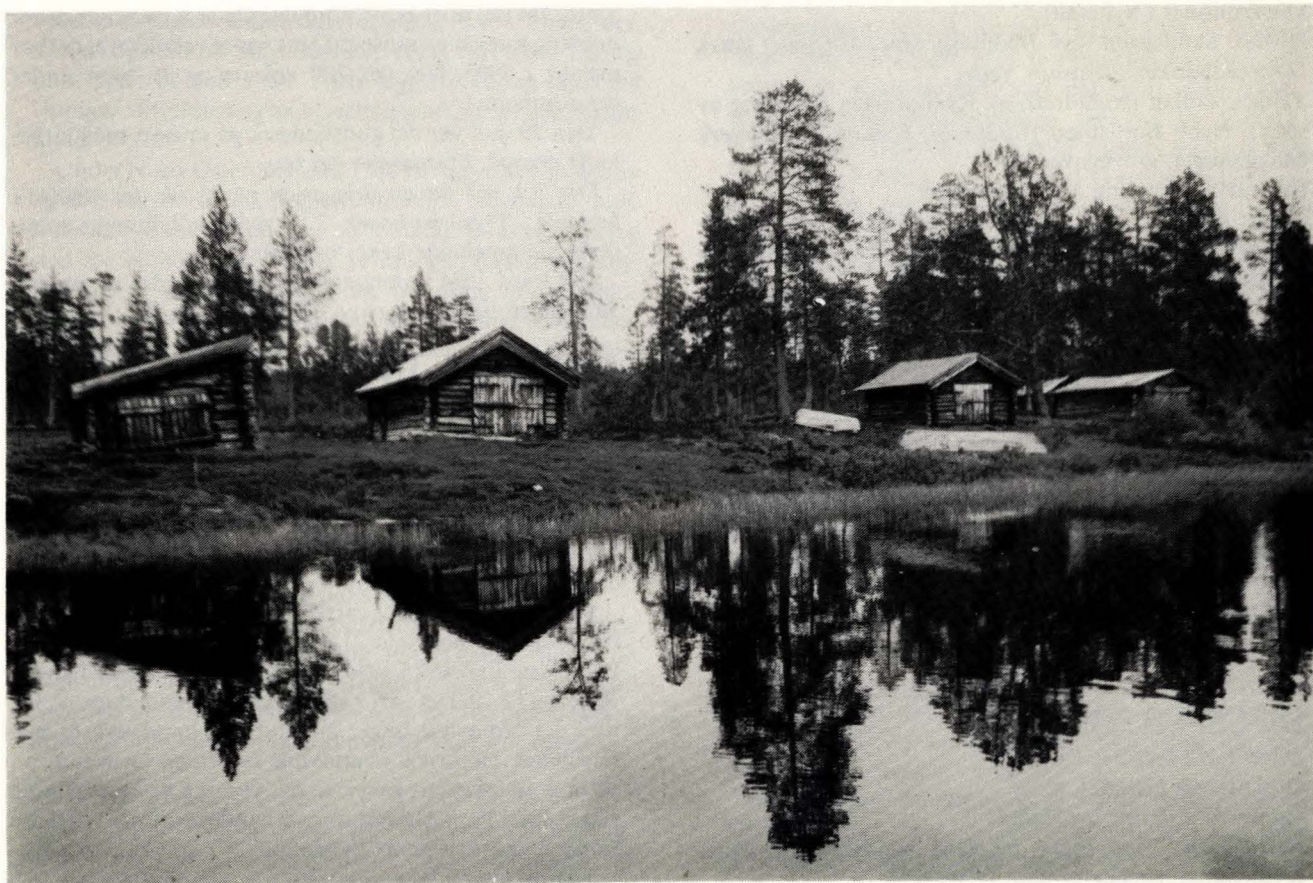
Idyll fra Sølenkroken, Rendalen.