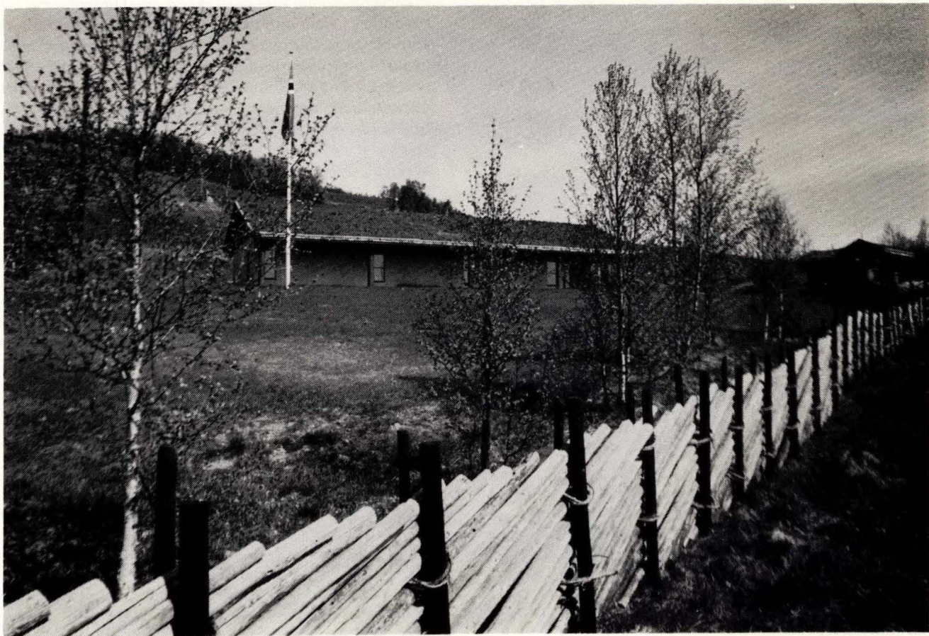
Vingelen Kirke- og skolemuseums nybygg med fin skigard som ramme.