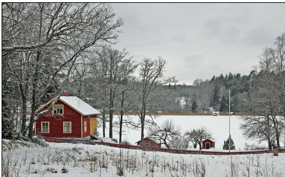
Sommarnöjet från öster. På bilden syns från vänster boningshuset, båthuset respektive badhuset. Tomten avgränsas med ett trästaket.