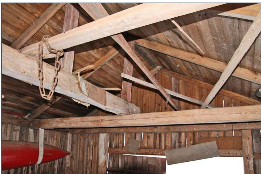
Taklaget med bindbjälkar, längsgående mittbjälke och sparrbärande stolpar.