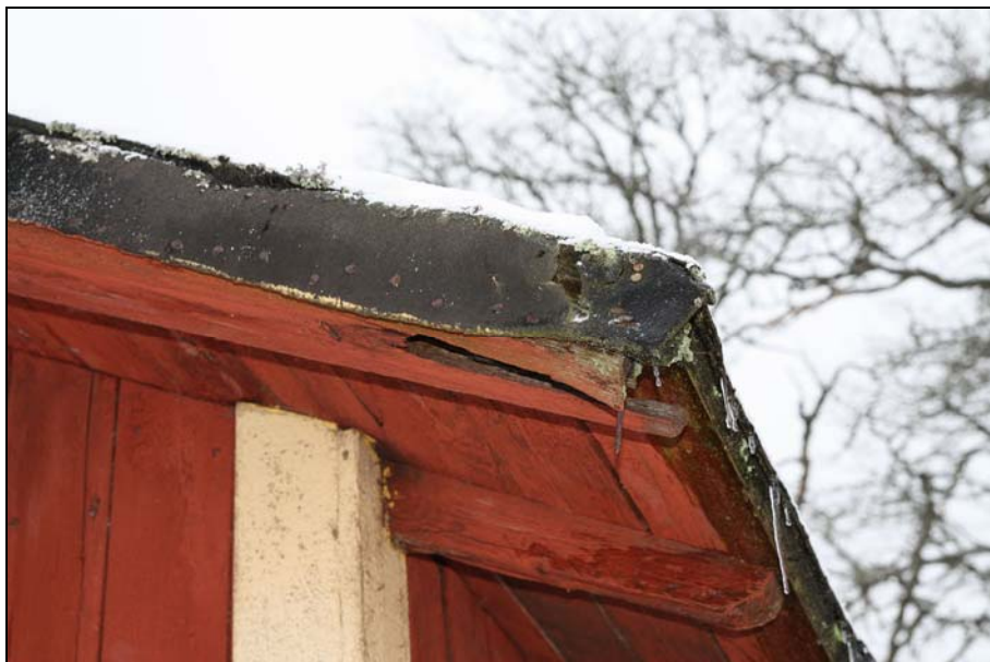
Detalj av papptakets läggning mot gavlarna. Pappen vikts ner mot en spikbräda och vindskivan spikas sedan mot den nedvikta kanten. Vindskivan är borttagen på bilden.

Trädäcket runt båtplatsen gjordes nytt för ca 10 år sedan. Det befintliga papptaket lades omkring 1965. Det består av asfaltsimpregnerad sandbeströdd lump-papp som är lagd i horisontella våder. Avståndet mellan skarvarna är ca 65 cm. Nocken är täckt med en ca 20 cm bred våd som vikts ner mot respektive takfall. Vid gavlarna har en spikbräda spikats på underbrädningen. Vådernas ändrar har vikts ner mot brädans kant och spikats fast. Därefter har vindskivorna spikats utanpå pappen. Taket har inga vattbräder.