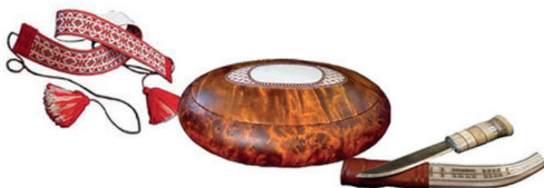
«Duodji er et av satsningsområdene for innsamlingen til Deanu ja Várjjat Museasiida /Tana og Varanger Museumssida»

Hvem har ansvar for utvikling av likeverd mellom folkegrupper, enkeltpersoner eller myndigheter? Hvilket ansvar har folkegruppene overfor hverandre? Det er ennå slik at det eksisterer mange fordommer om samiskhet og om det å være same, jfr. debatten i media om bruk av samisk språk og samiske kulturelle uttrykksformer. Mange opplever fremdeles at de blir møtt av diskriminering og mangel på forståelse. Samtidig uttrykker mange nordmenn at de føler seg tilsidesatt, og tidvis sett ned på av samer i samiske områder. Like viktig er problematisering av interne oppfattelser av sin egen identitet, tilhørighet og hierarkier; sjøsamer – reindriftsamer – bofaste samer og øvrig; kvener – finske etterkommer; - og hva med migrasjon av nyere innvandring? Hvordan har man oppfattet hverandre, og hvilke meninger har man tilskrevet hverandre? Hva kjennetegner kulturmøter som karakteriseres av gjensidighet, respekt og likeverd? Museene i Finnmark, sett på bakgrunn av regionens flerkulturelle befolkning og museenes samfunnsansvar, burde gå i spissen for å bringe frem bakgrunnen for motsetningene for å fremme forståelse og likeverd mellom folkegruppene. Like viktig er det å få frem de positive kulturmøtene og hvordan disse har utviklet seg.