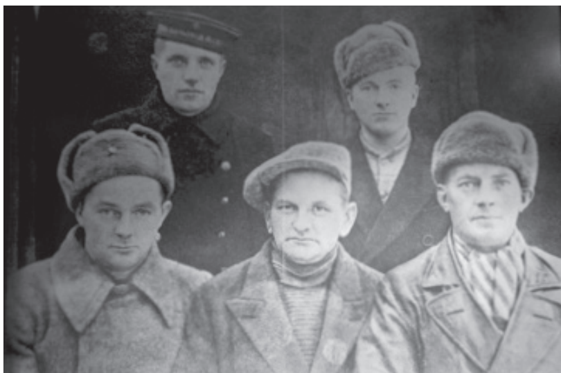
«Bildet viser en gruppe partisaner i Vardø»

føre til at forskningsresultatene blir mer interessant for publikum dersom deres innspill blir en del av forskningen. Det er også mulig å gå ut til publikum i denne forbindelse med forespørsler om de for eksempel har de gjenstandene som museene ønsker å samle inn. Flere av Finnmarksmuseene arrangerer kveldstreff der interesserte brukere presenterer hver sin gjenstand, og museet viser samlingsgjenstander som publikum har et forhold til. Slik kan man få dem til å dele av sin kunnskap om og/eller fortelle personlige historier om gjenstander som museene har i samlingene sine.