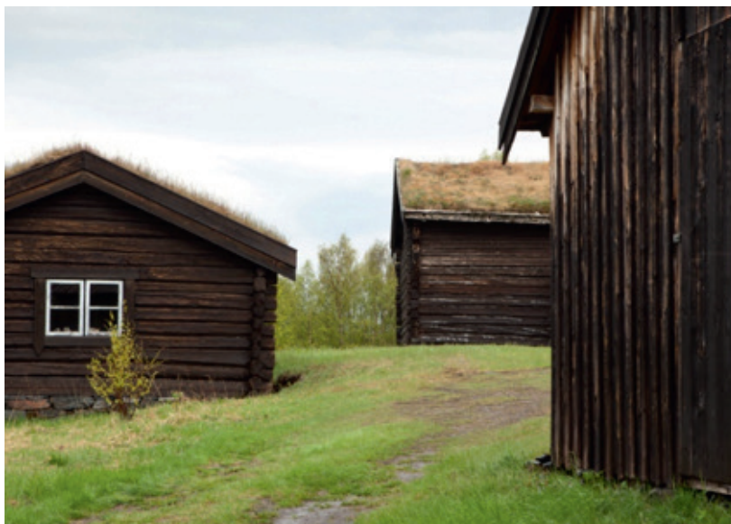
«Gårdsbildet fra Bjørklund gård i Pasvik. Eksempel på Varanger museums felles satsning, migrasjon»