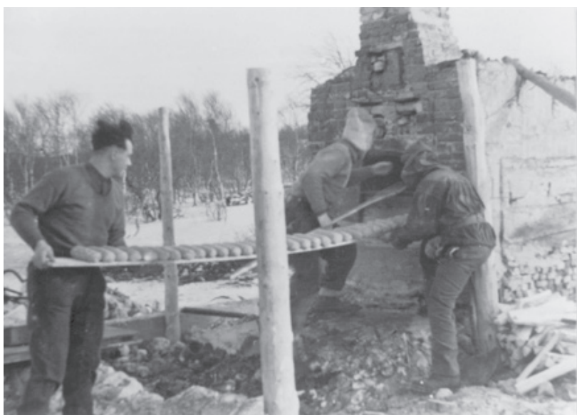
«Frigjøringen av Finnmark under 2. verdenskrig, norske soldater baker brød i friluft 1944/1945».

Planen skal konsentrere seg om aktivt samlingsarbeid av foto, gjenstander, kunst og immateriell kultur ( gjerne ved bruk av intervju, lydfilm med mer) med fokus på prosjekter med forhåndsdefinerte tema som er knyttet til kulturarven, historiske hendelser og aktiviteter tilknyttet fylket. Kulturarven og samtiden skal dokumenteres med de ulike kulturer og befolkningssammensetning i fylket; den samiske, finske, kvenske, norske, russiske og andre. Alle museene i Finnmark vil foreta en konkret og avgrenset innsamling av gjenstander, foto og fortellinger. Museene skal benytte seg av ulike metoder for innsamling og her vil ulike metoder for brukermedvirkning og systematisering av denne informasjonen bli viktig. Museene vil dermed også øke attraktiviteten som møteplasser for lokalsamfunnene. Et tydeligere perspektiv og en mer målbevisst innsamling og dokumentasjon av finnmarkshistorien vil styrke det faglige utviklingsarbeidet. Planen skal engasjere museenes fagpersonale slik at de ser egen innsamling som en meningsfylt del av en helhet. Et samarbeid mellom museumsenheter i Finnmark vil være viktige for å nå målene vi har satt, både under arbeidet med planen og i løpet av planperioden. Målet er å styrke kunnskapsinstitusjonene.