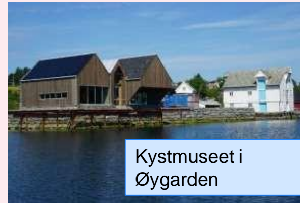
Kystmuseet i Øygarden