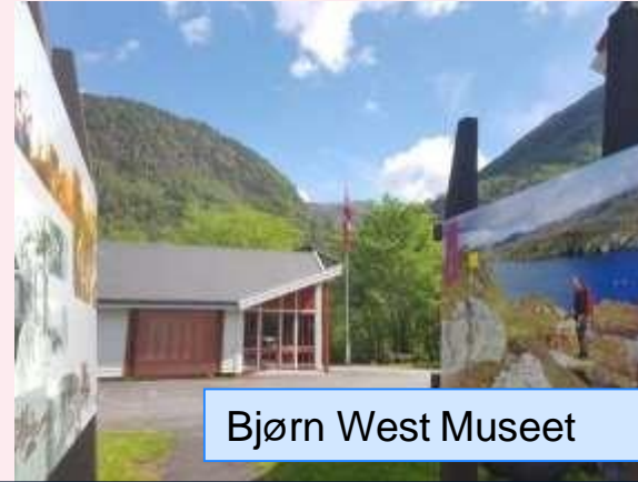
Bjørn West Museet