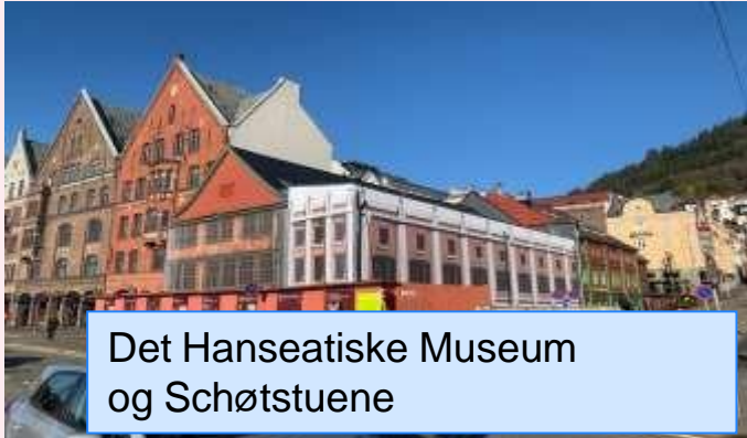
Det Hanseatiske Museum og Schøtstuene