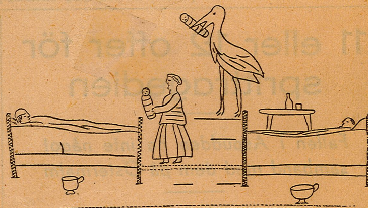
En figural ristning på tennfatet.

Att gravera blider på tennfat synes ha varit en ännu mycket sällsyntare sed här i Sverige. Däremot finns det fat från Nordtyskland och Holland med bildscener av ofta minst sagt mustig natur. Törnqvist har (väl på beställning?) framställt ett rum, golvtilljorna finnes åtminstone uppdragna, och i detta två stolpsängar (»standsängar») av gammal typ. Under vardera sängen står ett nattkärl och i sängarna ligger barnsängskvinnor. Den i högra sängen är tecknad mycket tunn och bredvid sig har hon på ett pallknan-