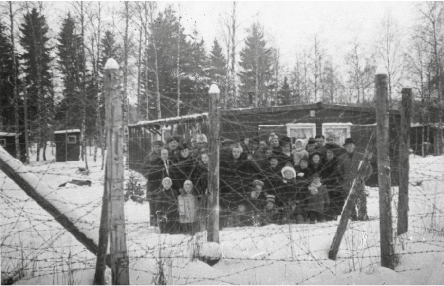
Estländska flyktingar i karantänläger hösten 1944.