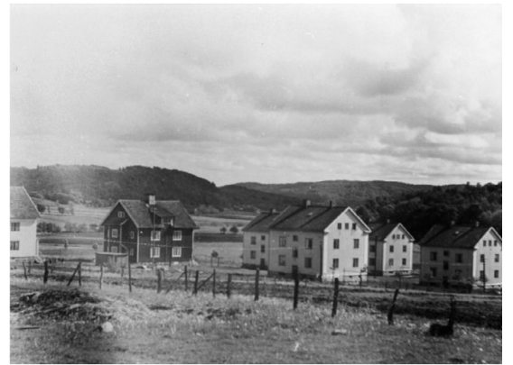
Fabriksbostäder, 1950-tal, vid Werners fabriker.