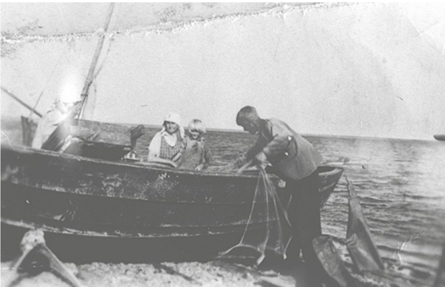
Ekan med vilken en estländsk familj flydde över Östersjön. Det var åtta personer i båten vid överresan till Sverige.

fällen. Estländarna fick varken startpeng, möbler eller husgeråd vid ankomst och fick därför jobba hårt för att skapa sig en tillvaro i det nya landet.