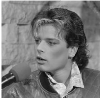
Stéphanie av Monaco, 1986.