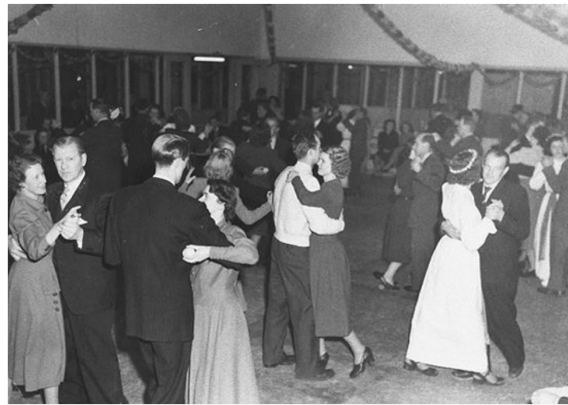
På Luciadagen gjordes en av Färgeriets lokaler om till dansgolv, vilket blev en årlig tradition.