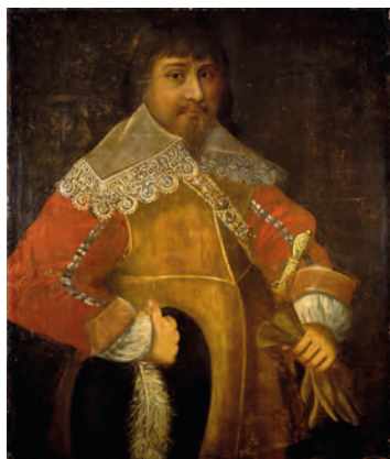
Selius Marselis (1600 – 1663), finansmannen fra Rotterdam som drev handel med hele Europa før han slo seg ned i Christiania. Der ble han rådgiver for stattholder Hannibal Sehested, långiver til kronen mot pant i krongods, og leverandør av skip og våpen mot betaling i trelast. Han ble en betydelig jordeier og bergverkseier i Norge, og direktør for postvesenet. Han bygget det store landstedet Marselienborg på Bymarken ved Pipervika. Han døde i København etter å ha deltatt med ære i forsvaret av byen i 1659.