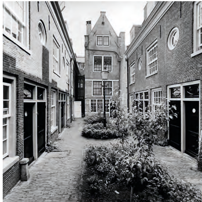
T.v. Fra gårdsplassen i Claes Claeszoon Anslos aldershjem i bydelen Jordaan i Amsterdam. Foto fra før istandsettelsen i 1960-årene.