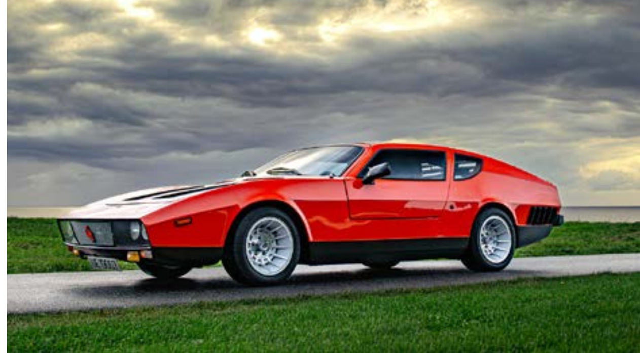
Designet fra 1968 ble virkeliggjort i 1972. Her er Stranden Scorpione fotografert i 2023 kort tid før den skulle hentes for å bli stilt ut i kjøretøymuseet ved Norsk vegmuseum.

Den fikk det italiensk-klingende navnet Scorpione, for å tydeliggjøre hvor jeg fikk inspirasjonen til linjeføringen. Konturen skulle være kileformet med høy hekk. Jeg mente at turbulensen bak ville gi et «drag» som stabiliserer ved høye hastigheter, selv om det kostet noe i topphastighet. Detaljplanleggingen fore-