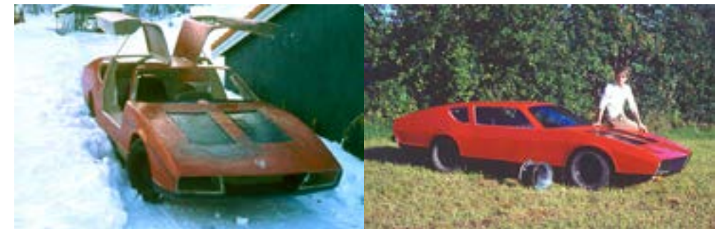
Farge ble blandet i det ytterste laget med polyester. Fra det helstøpte skallet ble dører, panser- og motorluke saget ut, og alle deler ble gjenstand for videre arbeid med avstivning og forsterkninger. Etter en lang prosess med sparkling og sliping ble påført en testlakk som underlettet den endelige avretting og finish.

Etter første gangs lakkering så bilen litt mer ferdig ut, men hensikten med denne var kun å underlette den endelige avretting og finish. Legg merke til felgen - den var 10 tommer bred for bakhjulene, foran valgte jeg 8 tommer, spesialsveiset i Sverige. Temmelig uortodoks på den tiden. Jeg måtte velge stålfelg - dette var langt billigere enn aluminium og eneste realistiske alternativ for min studentøko-