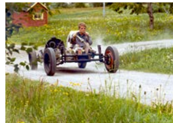
Understellet kommer fra en kollisjonsskadet 1959 modell VW Boble, og var kjørbart også etter at karosseriet var fjernet. (Foto: Kolbjørn Ringstad).

Som nevnt var planen å benytte understellet fra en VW Boble. Jeg skaffet en billig, kollisjonsskadet VW 1200 1959-modell i nabobygden Sykkylven og fjernet karosseriet, noe som var meget enkelt. Tilbake sto et fullt kjørbart understell.