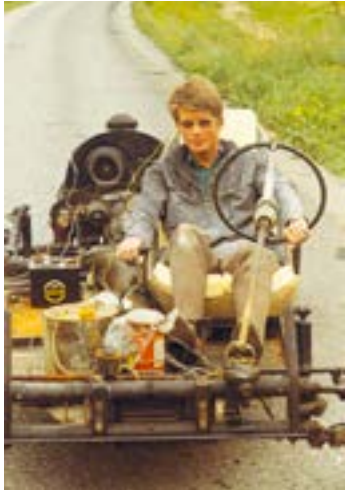
Bensintanken under testturene var et 10-liters spann, med en enliters malingsboks som reservetank. Ikke akkurat etter dagens sikkerhetsstandarder, reflekterer Stranden i dag

Klargjøringen av understellet var en morsom periode med mye testkjøring, blant annet til noen lokale fjelltopper - fremkommeligheten var meget god.