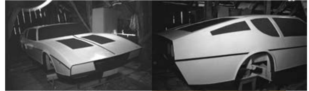
Støpeformen ble laget av spanter påsatt 1x1 cm trelister som lett kunne formes til riktig fasong, pålimt avisappir og justert med avrettingsmasse slik at produktet etter ca. 14 mnd. arbeid ble som vist her.

Etter at skallet var ferdigstøpt ble støpeformen fjernet bit for bit, og arbeidet med å bygge detaljer innover startet. Det ble også lagt på flere lag glassfiber på innsiden, sammen med profiler, som forsterkning. Opptil 20 lag ble bygget på slik at bilen mot sidekollisjon tåler et press på 2500 kg pr. cm 2 . «Bilfabrikken» var nå