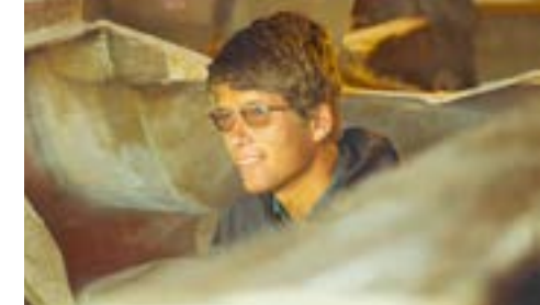
Her ligger karosseriet opp-ned mens slike detaljer ble laget. Det ble mye snuing underveis.

flyttet til vår garasje, og på vinterdager var det ikke lett å få temperatur nok til herdeprosessen for polyestere.