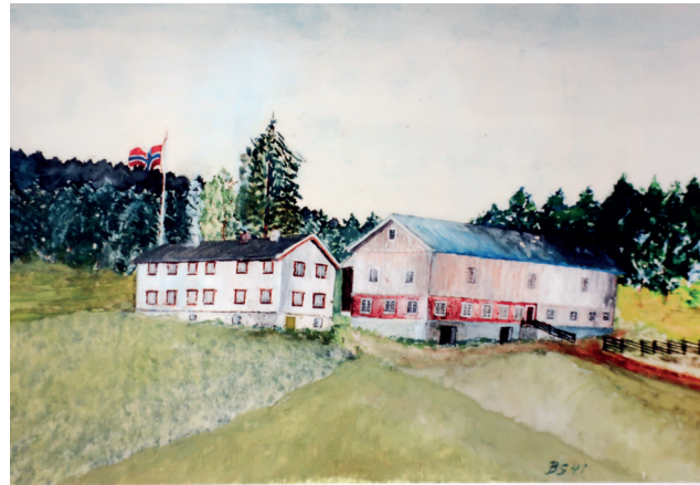
Tegning av Skågset i 1941 med våningshuset fra 1870-tallet og låven bygd i 1937. Disse ble revet på 1950-tallet da gardstunet ble flyttet nærmere hovedvegen. Tegnet av Bjarne Skogseth.

Trondheim, kom videre til Bjugn i Fosen, før han bosatte seg på Frosta, og ble stam-