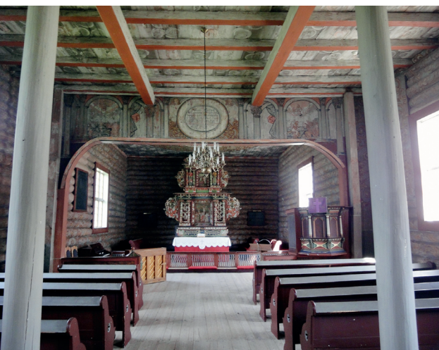
Interiør i Tyllaldalen kirke i 2014.