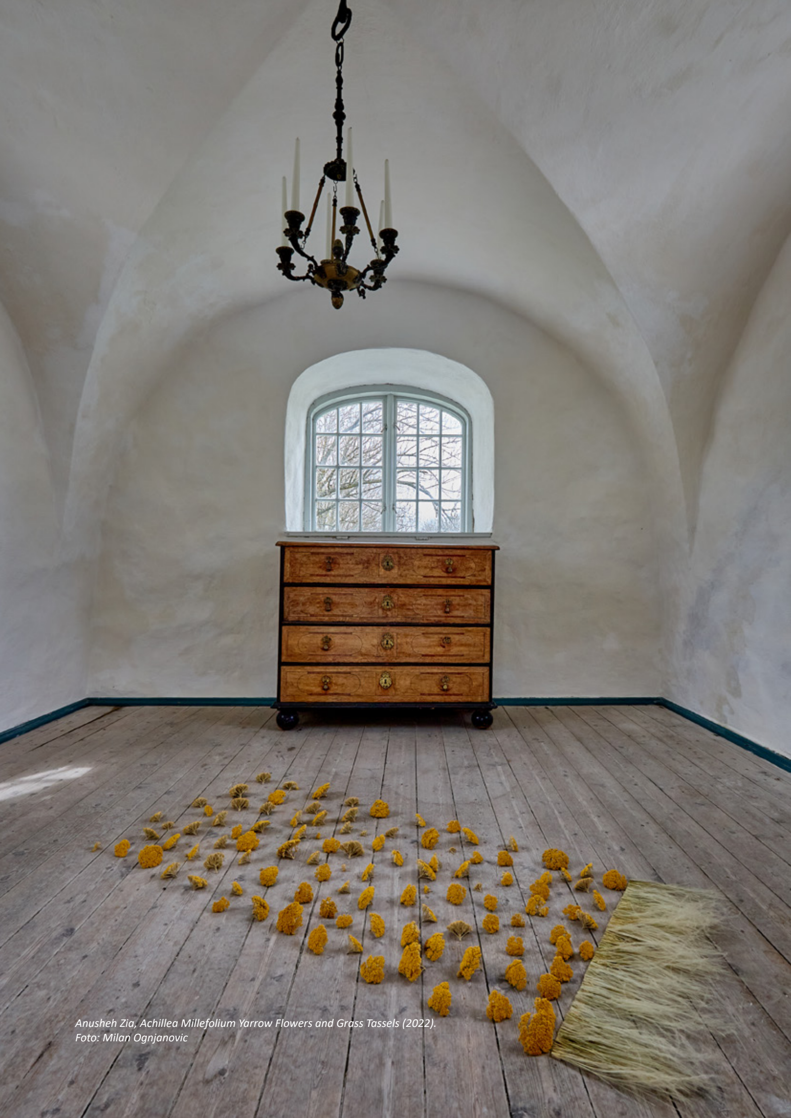
Anusheh Zia, Achillea Millefolium Yarrow Flowers and Grass Tassels (2022).