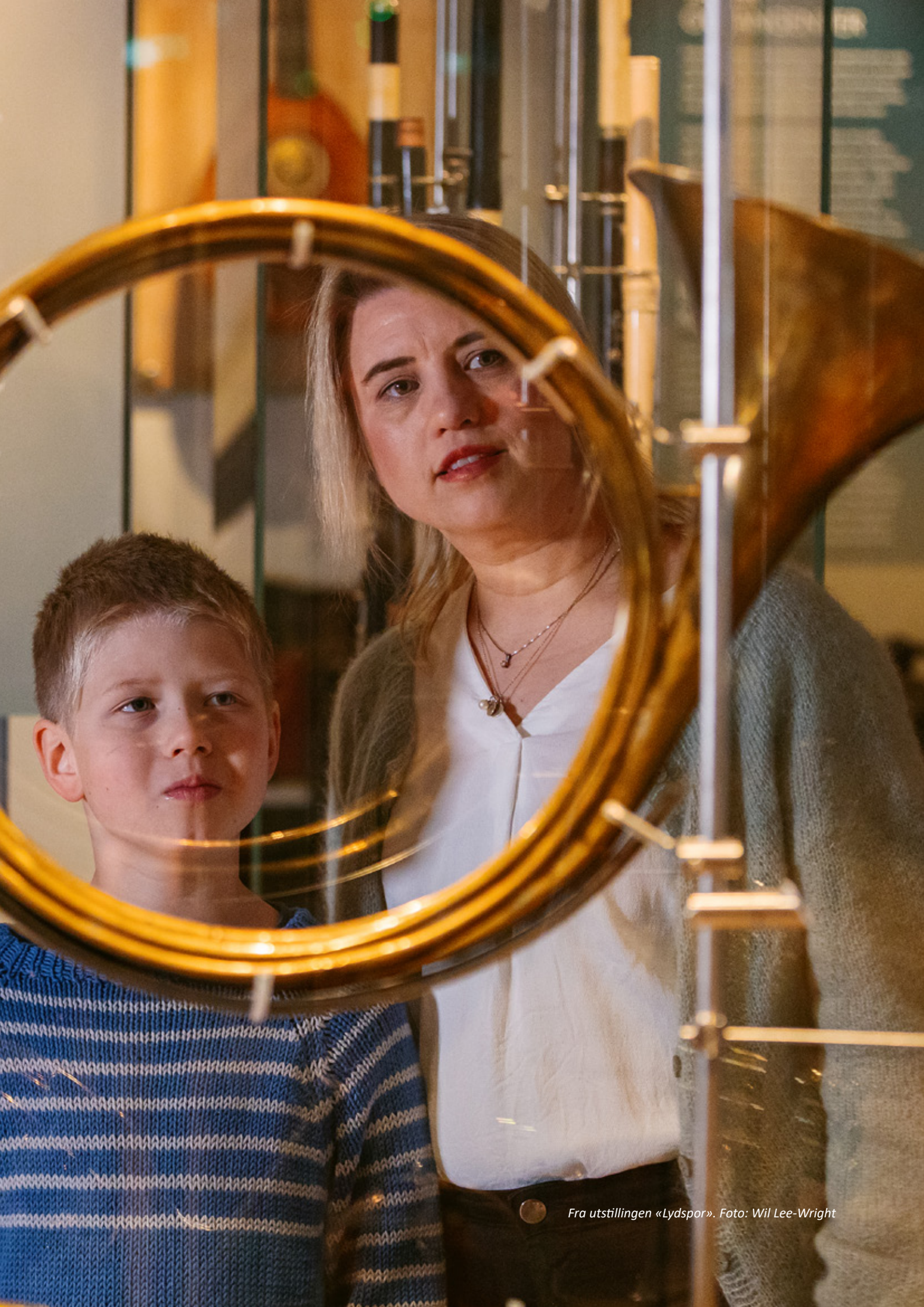
Fra utstillingen «Lydspor».