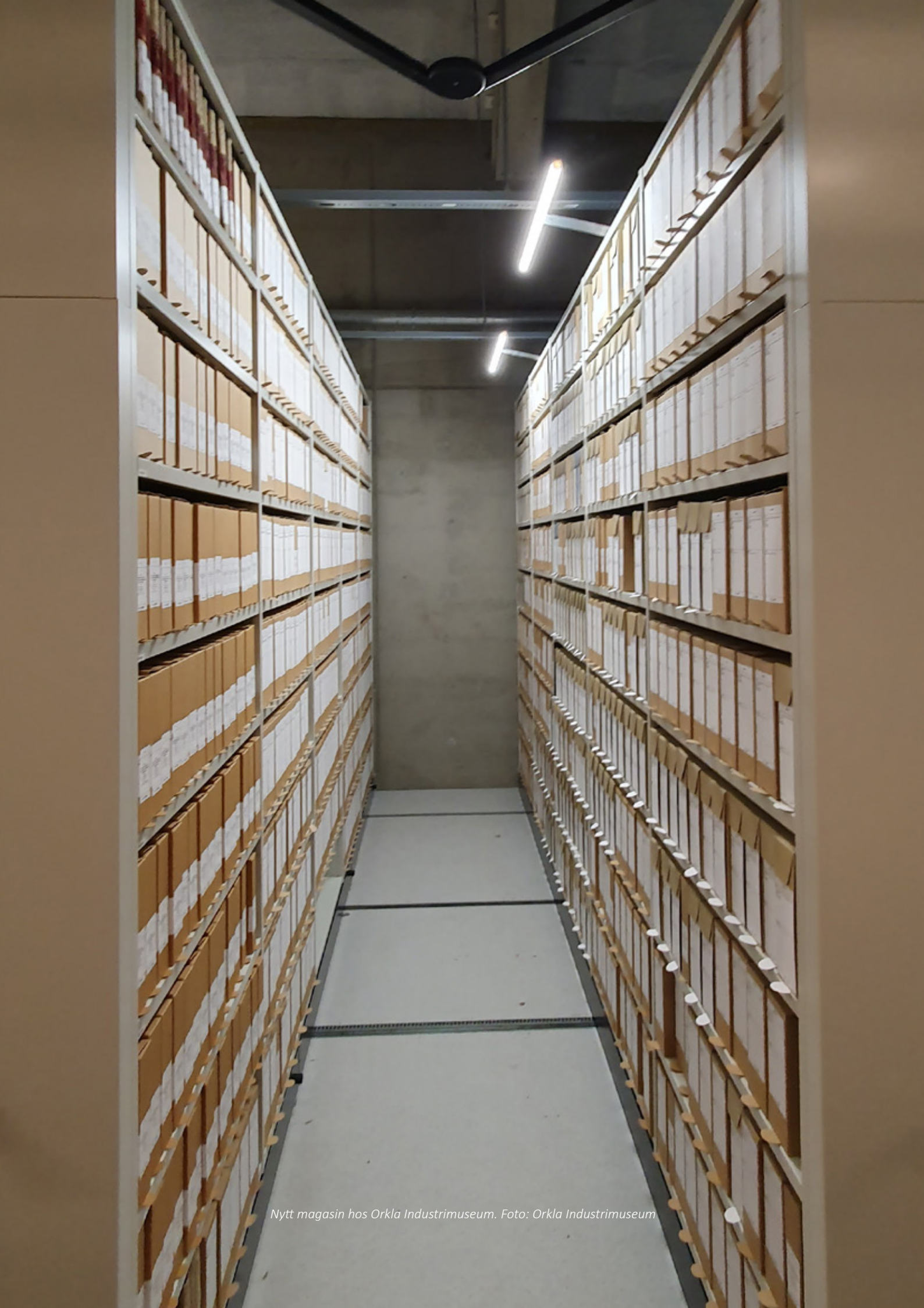
Nytt magasin hos Orkla Industrimuseum.