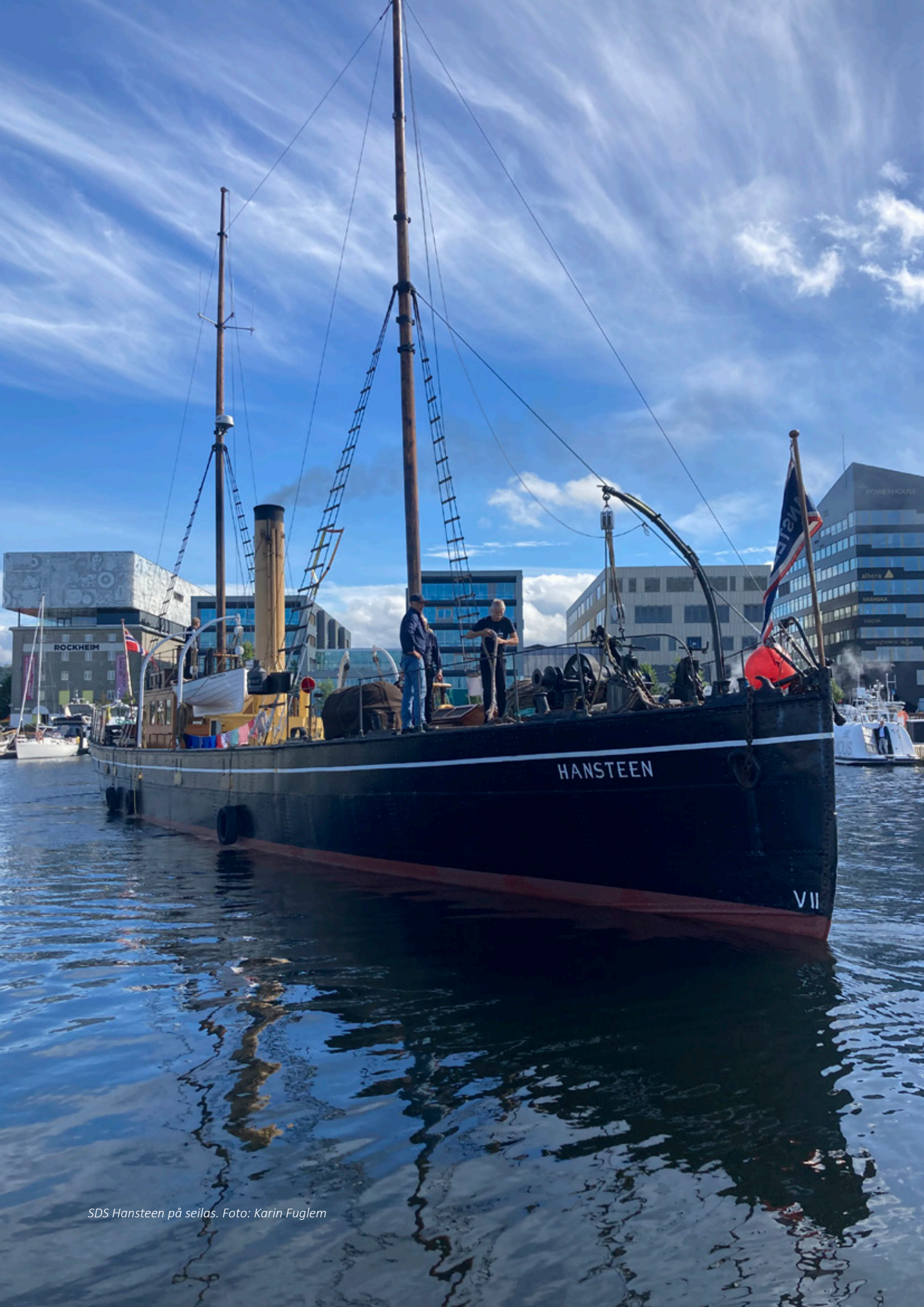
SDS Hansteen på seilas.