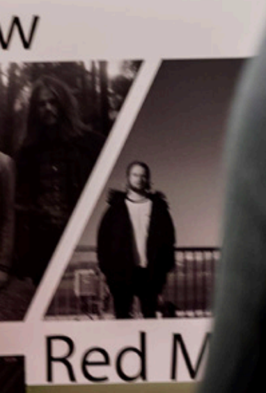
Fra utstillingen «Mitt stille land».

BILLETT I DAG! BERGENFEST.NO REDAG 12.6 RA LARSSO EZINANDO IE NICOLA CINEMA CLU DE LERC AN • RU HAG TROM