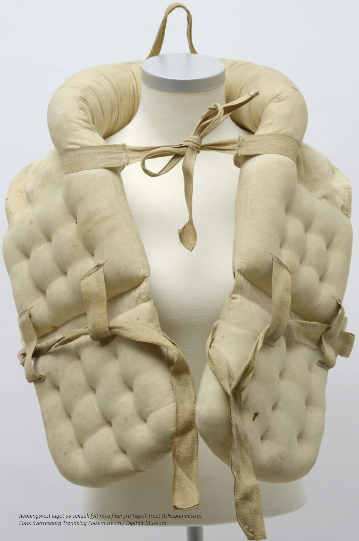
Redningsvest laget av seilduk fylt med fiber fra Kapok-treet (Silkebomullstre).