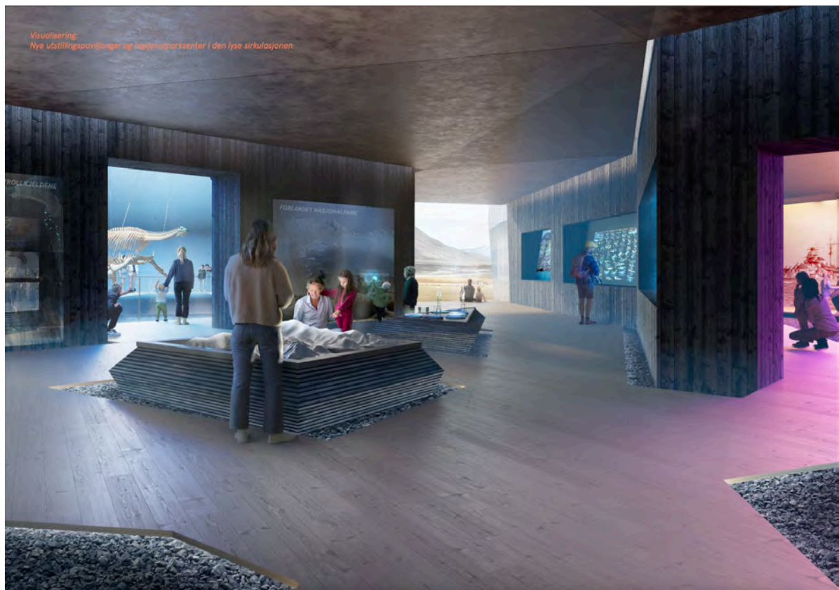
Visualisering av en fremtidig utvidelse av Svalbard museums lokaler. Animasjon: LPO Arkitekter

Svalbardmeldingen og masterplan for reiseliv peker på behovet for å konsentrere turismen i Isfjorden og legge til rette for lengre opphold for de som kommer til Svalbard. Dette krever bedre tilbud til turister i Longyearbyen tilpasset flere gruppers kjøpekraft, samtidig som vi må informere om de områdene som blir mindre tilgjengelige.