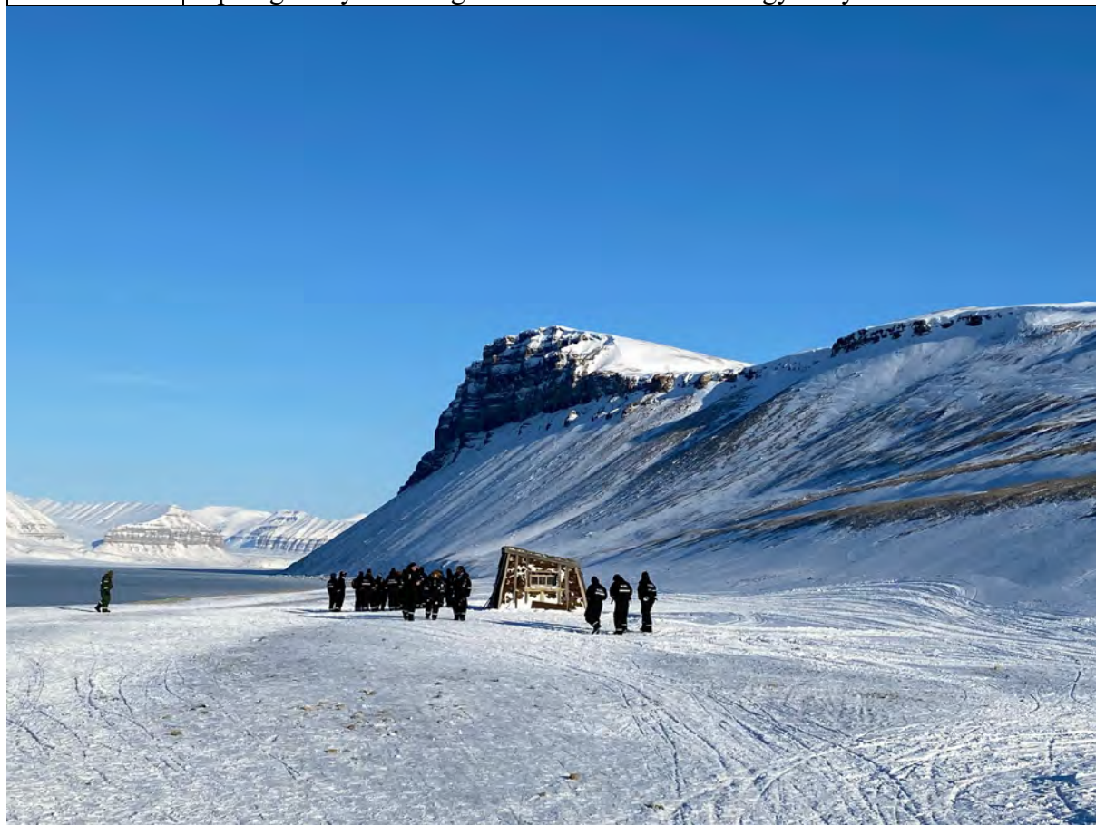
Den åpne dagen på Villa Fredheim var godt besøkt i maksvejr i mars. Gruppe utenfor Danielbu.