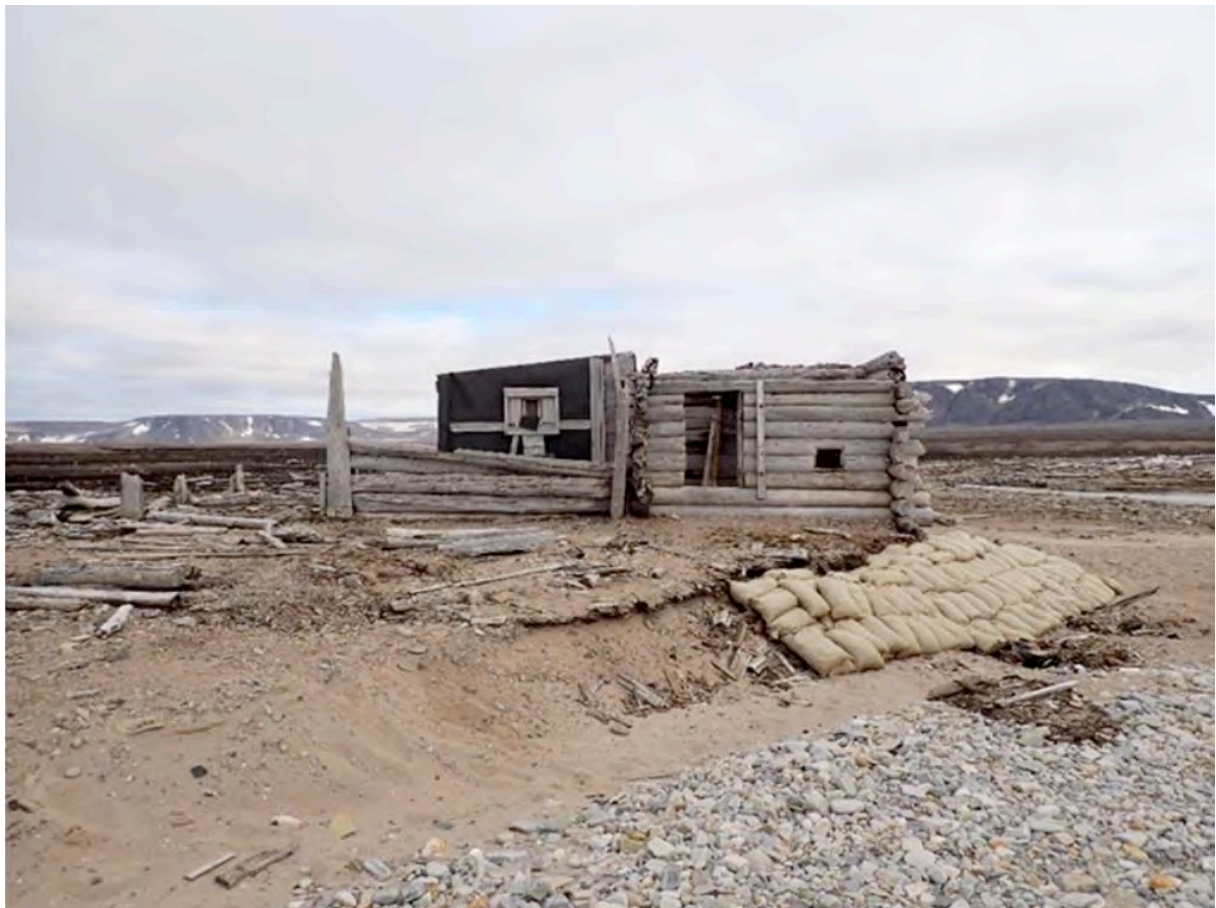
Fangsthytta i Rekvika før utgraving og fjerning.