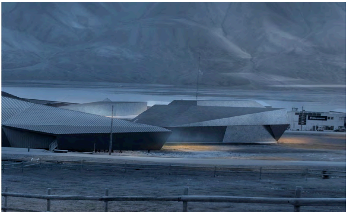
Visualisering av en fremtidig utvidelse av Svalbard museums lokaler. Animasjon: LPO Arkitekter

Det ble gjennomført en mulighetsstudie i samarbeid med LPO arkitekter som viser at det er mulig å få på plass en utvidelse i tilknytning til dagens lokaler på ca. 1300 m 2 . Museet vil gå videre med dette i 2023 i samarbeid med Statsbygg og vil arbeide for å sikre finansiering av en utbygging.