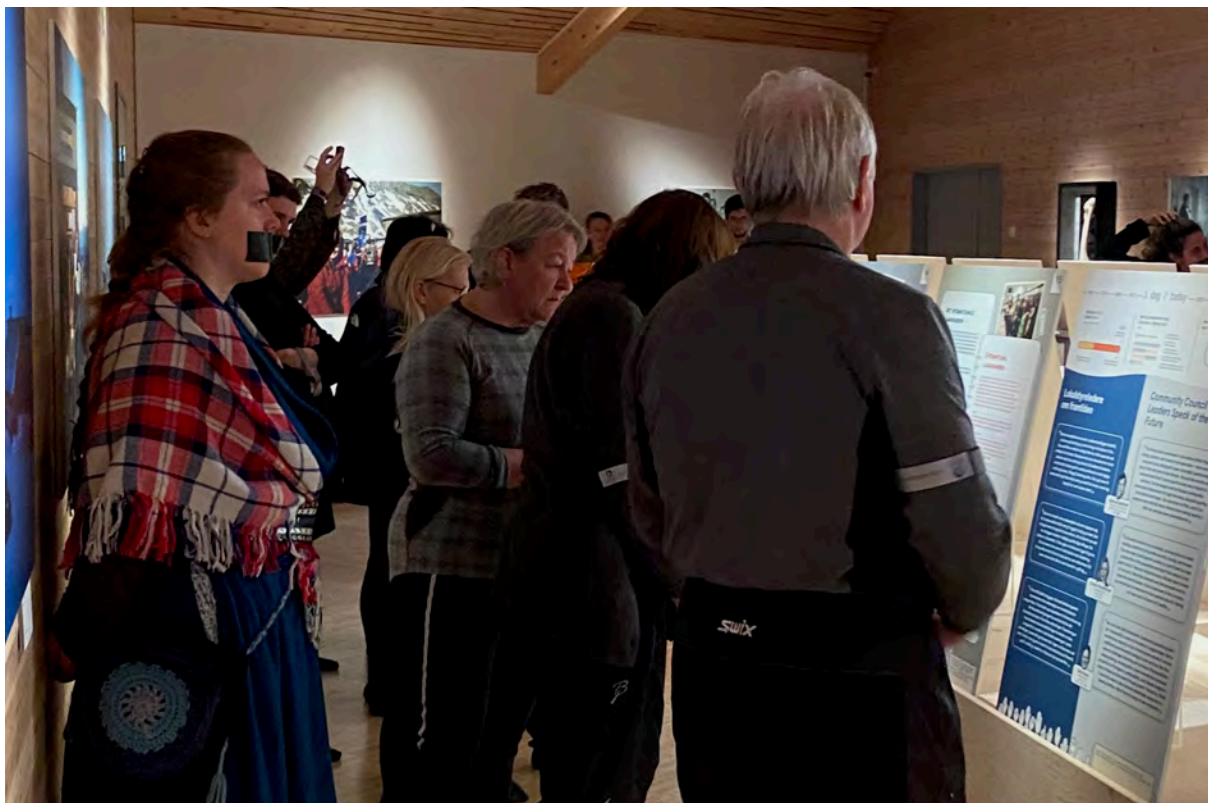
Fra åpningen av demokratiutstillingen. Flere personer fra den internasjonale befolkningen i Longyearbyen brukte åpningen som en arena for å demonstrere mot de nye stemmerettsreglene.