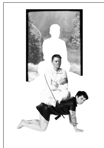
© Paulina Tamara, Marite riding Paulina, 2022 Preus museums samling

Tilvekst tilkommet etter 1995 har derfor hatt hovedfokus på norske fotografer og samtidskunst. Et prosjekt i 1998 undersøkte hvilke fotografer som hadde deltatt på utstillingene arrangert av Forbundet Frie Fotografer mellom 1976 og 1992, og et utvalg fotografer som hadde vært aktive over hele perioden ble valgt ut for innkjøp. Prosjektet ble lagt på is i 2001 da utgiftene til driften av museet steg.