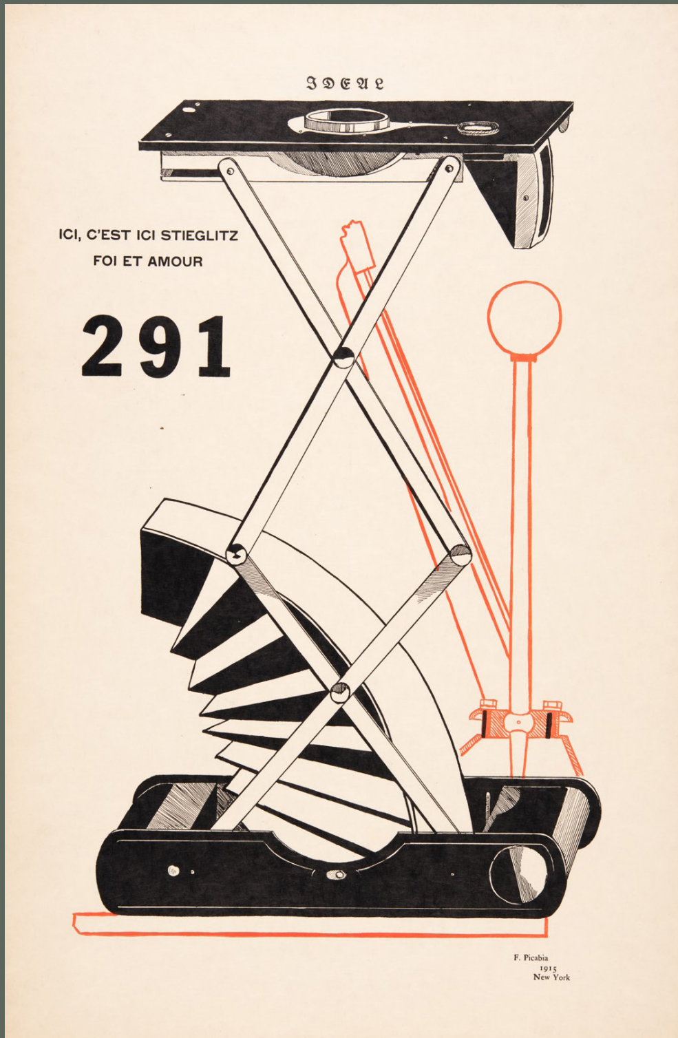
Francis Picabia (1879-1955), tegning til Dadaist-tidsskriftet 291, 1915