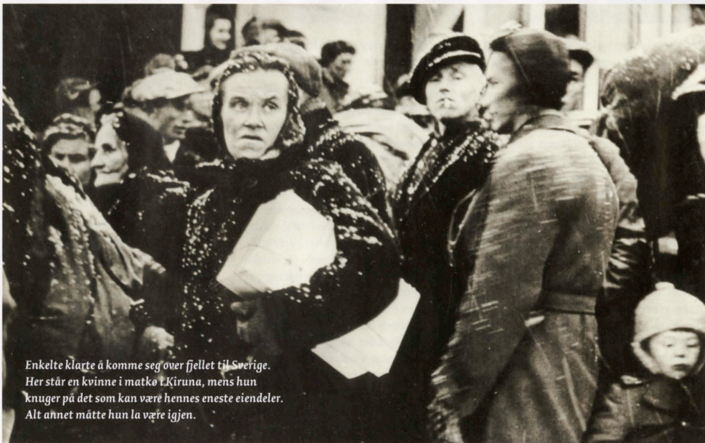
Enkelte klarte å komme seg over fjellet til Sverige. Her står en kvinne i matkø i Kiruna, mens hun knuger på det som kan være hennes eneste eiendeler. Alt annet måtte hun la være igjen.

En gutt lå i skjul og ble vitne til at bygda gikk opp i flammer. Han var sammen med broren og forteller: "Jeg var sju år. Vi hadde jo sprunget ifra den hytta der vi bodde bare for å se når de brente. De skjøt også