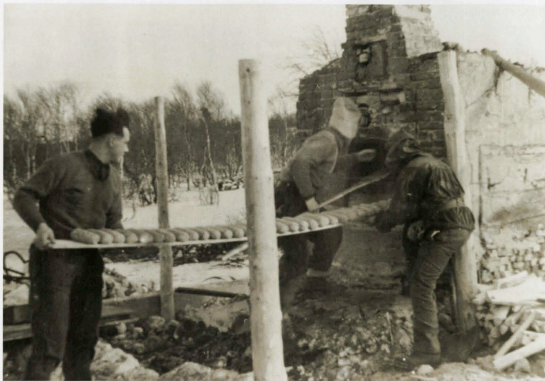
Etter fem år med krig og stagnasjon var gjenoppbyggingen av Nord-Norge en enorm utfordring. I første omgang var det kun arbeidsføre håndverkere som fikk vende hjem.

I løpet av høsten 1944 og våren 1945 ødela de tyske troppene 11 000 bolighus, 4700 fjøs og uthus, 230 bygninger for industri