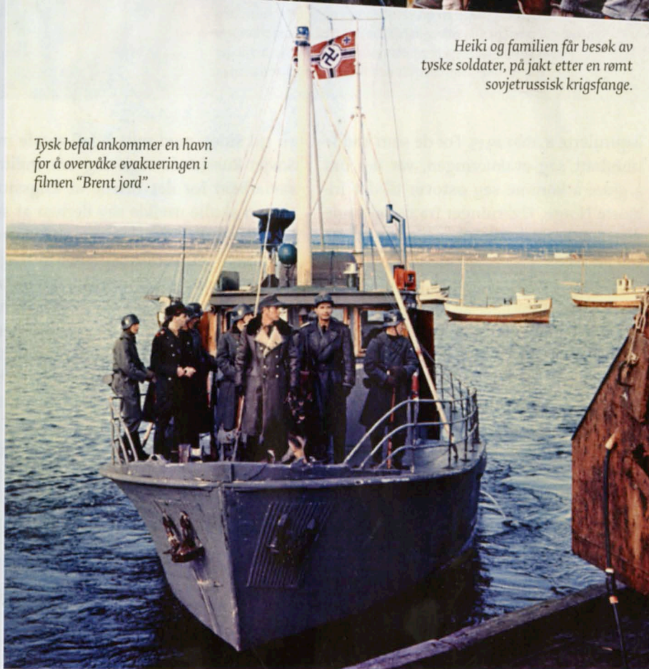
Tysk befal ankommer en havn for å overvåke evakueringen i filmen “Brent jord”.