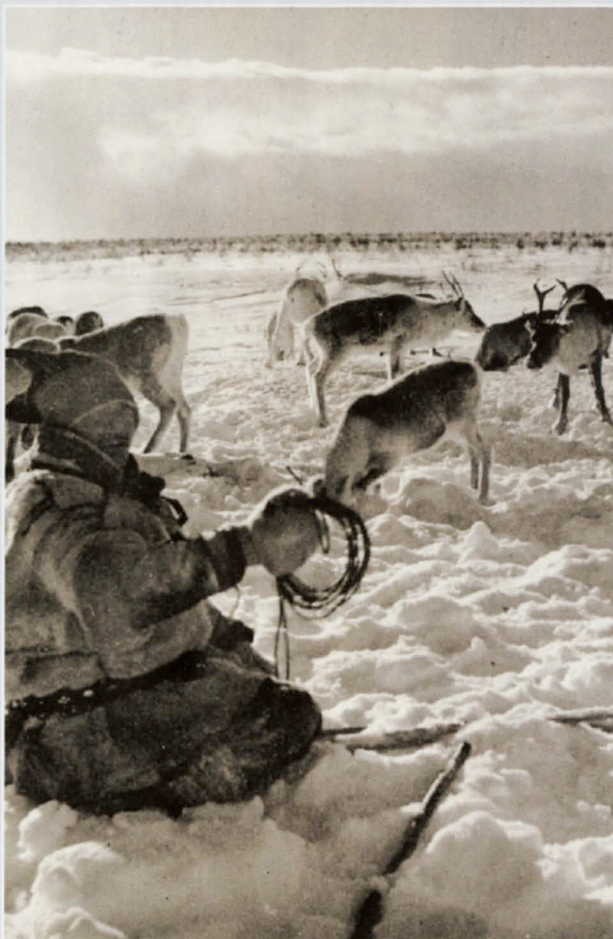
Alle skulle evakuere, og samene var intet unntak. Men å skulle tvangsflytte et nomadisk folk med tusenvis av reinsdyr kom til å by på store utfordringer.

Mange av sjøsamene ble bosatt langs kysten av Trøndelag, blant annet på Kvalvær i Frøya, der de ble tatt godt vare på av befolkningen.