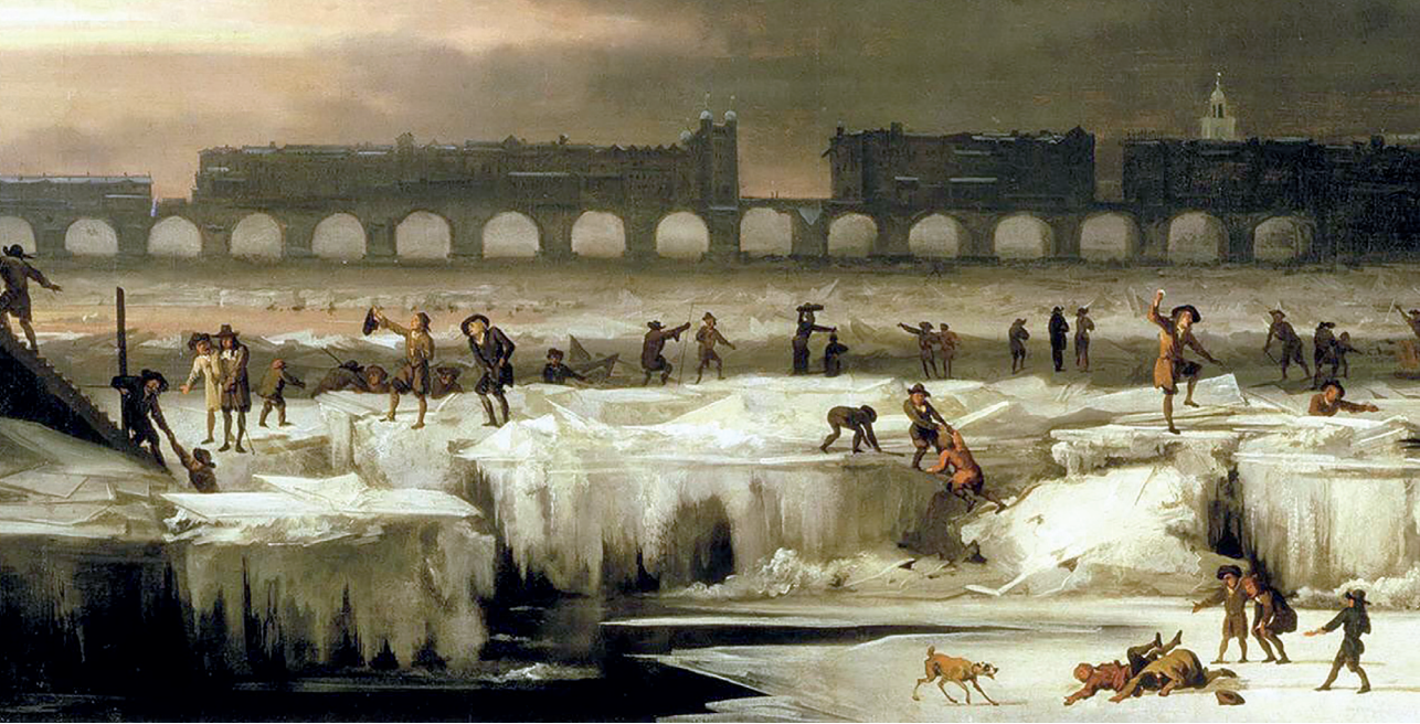
Hondius, Abraham «The Frozen Thames» 1677.