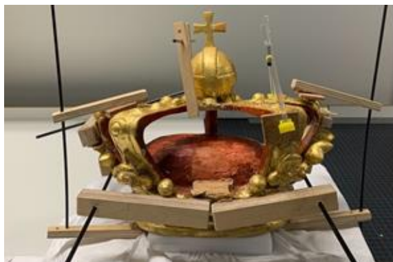
Krona under limingsprosessen