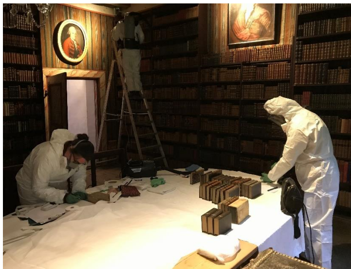
Muggsanering av bøker

26. og 27. mai var tekstilkonservatorane på Baroniet Rosendal for å reingjere den franske tapetet frå 1660-åra som vi konserverte i 2012. Biletrammer, speil og gjenstandar i rommet vart og reingjort både på baksida og oppå. Den 6. og 7. juli var vi tilbake for å slutføre reingjeringa av Statthaldarkammeret som vi starta opp i mai. Alle bøkene i rommet er no muggsanerte. Vi gjorde også ei synfaring med tanke på ei mogleg utplassering av varmekammeret på Baroniet neste år. Det vart plassert ut insektfeller i museet, slik at vi kan starte opp arbeidet med kartlegging av skadedyrsituasjonen. Vi pakka ned og tok med oss to golvteppe frå Baroniet for frysing og reingjering etter skade frå insekt.