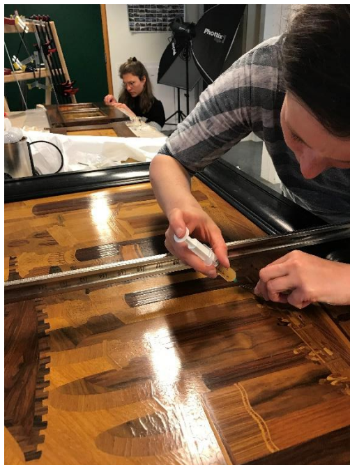
Konservering av intarsia på Knag-møbel

I januar starta vi også med konservering av møbler som skal inn i Knag-utstillinga som opna 14. september 2020. Totalt har vi konservert 10 møblar. I byrjinga av september var vi på KODE 1 for å reingjere og tilstandsvurdere alle dei innlånte møblane som skal vere med i utstillinga.