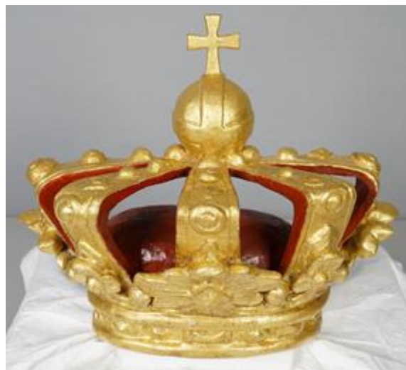
Framsida, etter konservering