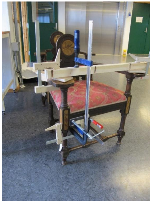
Konservering av Knag-stol