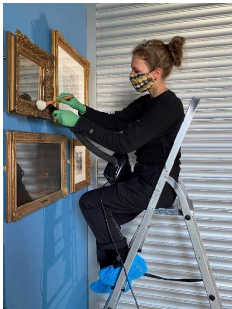
Reingjering av biletramme, Singerutstillinga

Vi har arbeida saman med KODE med å ta ned Singer-utstillinga på KODE 1. Mange gjenstandar av keramikk, metall, tre og stein samt nokre møblar måtte reingjerast og pakkast for å kunne transportere dei til fellesmagasinet i Salhus.