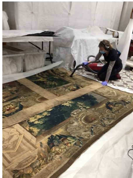
Reorganisering av tekstilmagasin

I desember 2020, har vi halde fram med reorganisering av tekstilmagasinet på KODE 1.