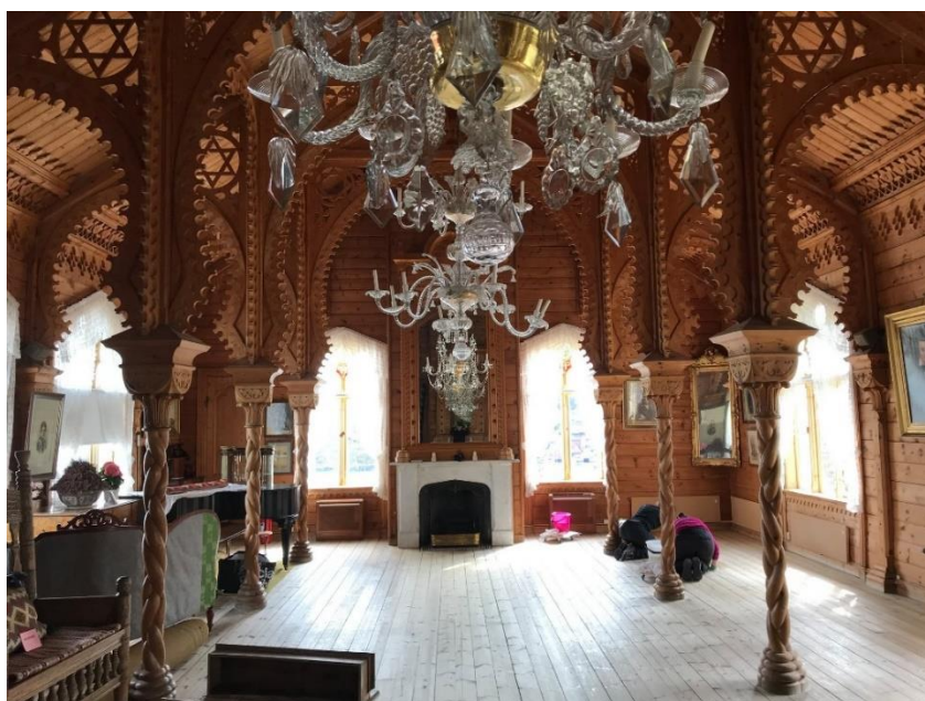
Reigjering av golvet i musikkhallen

Vi har reingjort tregolvet i musikkhallen på Lysøen og alle gjenstandar som står i dei tre hovudromma i første etasje.