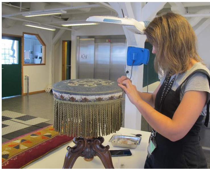
Krakk og pute under konservering

Eit nyinnkjøpt tekstilkunstverk kalla «Vy», av ein kunstnar frå Alaska, var møllangripe, så det gjekk gjennom frysing hos oss, før det vart flytta tilbake til KODE for magasinering.