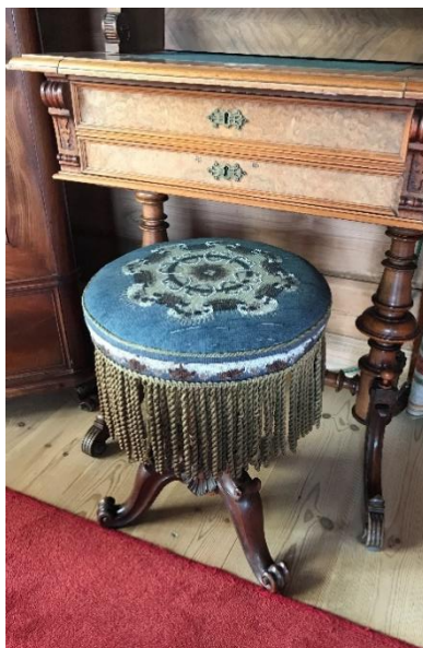
Krakk tilbake på Troidhaugen

Blondegardinene som heng i vindauga i villaen på Troidhaugen vart tatt ned og vaska på Bevaringstenestene, og deretter hengt opp igjen. Vi har også konserverert ei stolpute og ein pianokrakk frå Troidhaugen. Begge gjenstandane er no tilbake i utstillinga på museet.