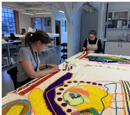
Kunstverket under konservering

Seks messehaklar og eit biletteppe frå Ørsta kyrkje er konservert etter at dei var skada etter brann i kyrkja i 2017. Alt er no reingjort. Messehaklane har fått nye polstra hengarar for å gje god støtte ved oppbevaring. Biletteppet har fått nytt oppheng.