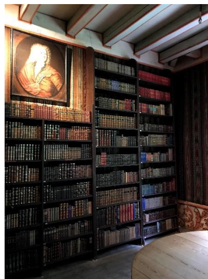
Bokhyller etter sanering