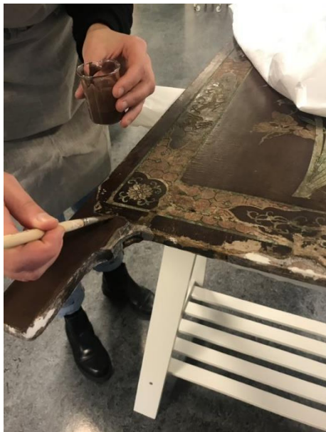
Konservering av skjermbrettet