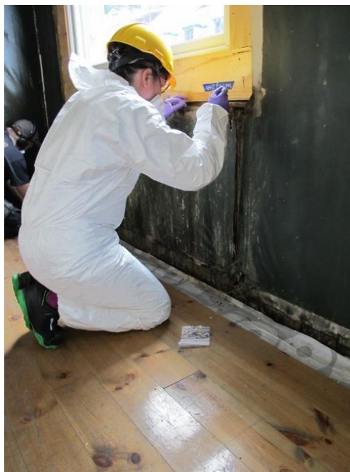
Demontering av tapet, Hanseatisk museum