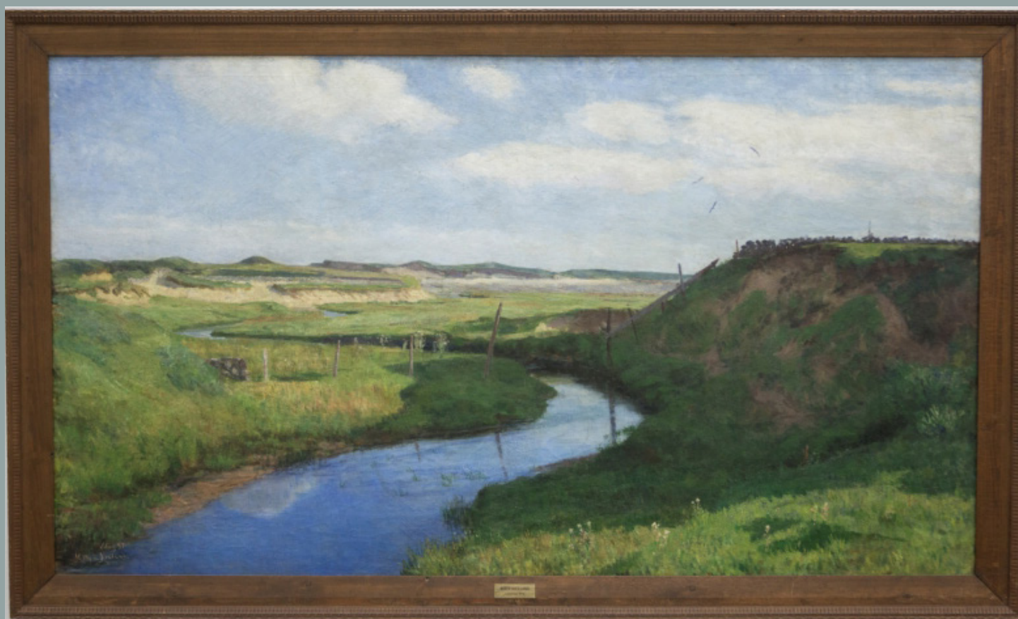
Kitty Kielland, Landskap, Wiig, 1897 Olje på lerret. Kjøpt 1901 for Brændevinssamlaget's bidrag.

DET ER EN VARM SOMMERDAG OG DU SER UTOVER DET LANGSTRAKTE LANDSKAPET. SER DU ELVEN SOM BUKTER SEG INNOVER, OG EN KU LANGT DER BORTE? DU KJENNER AT DET BLIR LITT KJØLIGERE I DET EN SKY SMYGER SEG FORAN SOLEN OG LEGGER DET GRØNNE GRESSET I SKYGGE.