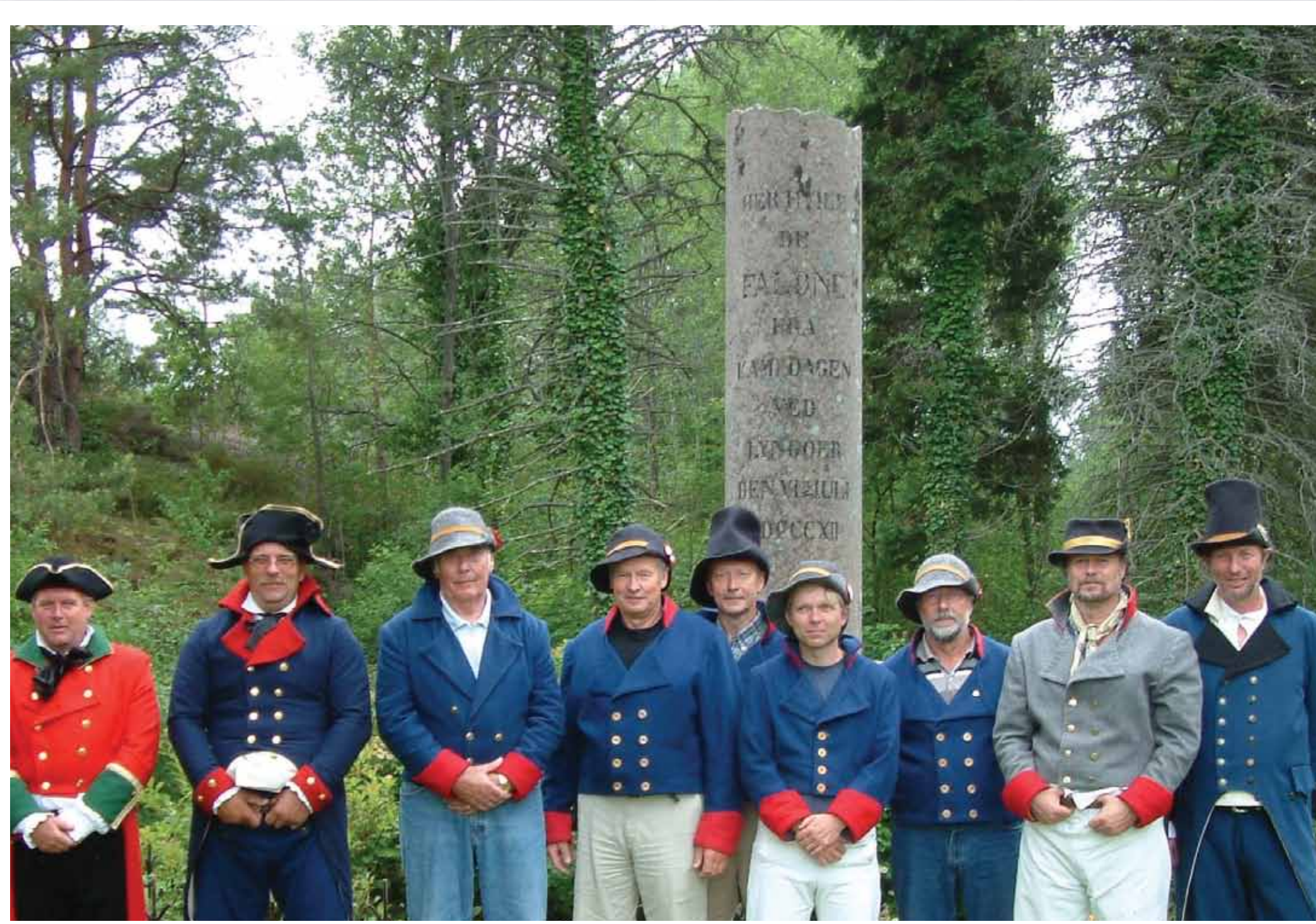
Øster Riisør III deltagelse ved minnemarkering på Askerøya