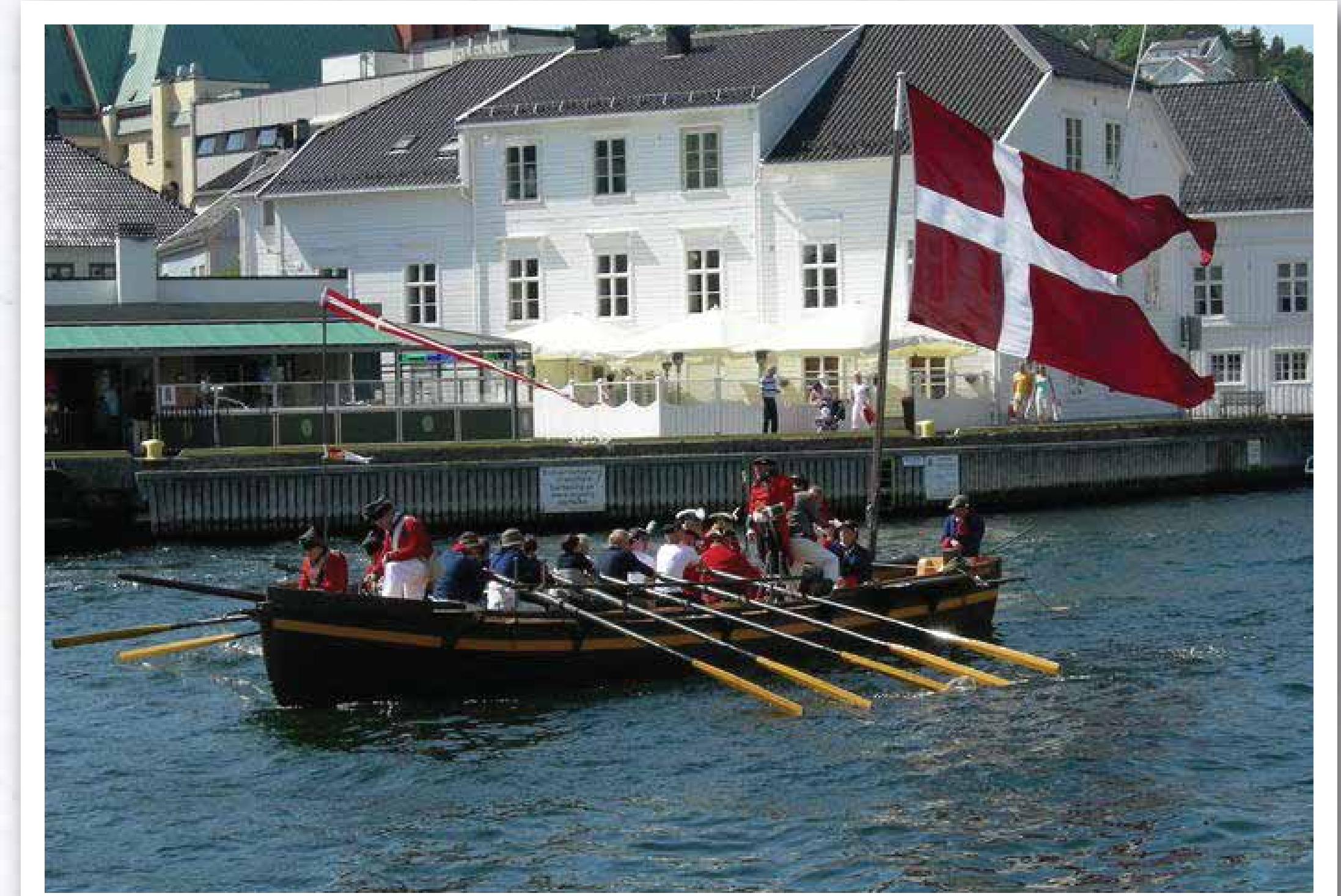
Kanonjolle, Øster Riisør III